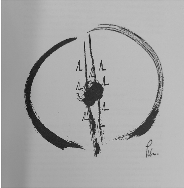
Abb. 4: Gestirn in Schmidts Sitara 36

Aber mit dem Hintern (›PoePo‹), der den Mischtext eröffnet, als chiffrierter Name und mit der Schreibmaschine getipptes Textbild, ist es längst nicht getan. Die Fäzes und Buchstaben drängen heraus, auch noch jenseits von Metonymien und Homonymien, überschwemmen geradezu den Text. Eingeführt wird der ›Kot‹ ganz derb auf der Handlungsebene, die zumeist die Mitte der Textspalten bildet, mal mit der rechten oder linken zusammenfließend, mit den Assoziationen Pagenstechers und Belegzitate von Poe und diverser anderer Autor*innen. Paul, Wilma, Dän und Franziska wandern morgens vor vier Uhr über das Grundstück, damit letztere ihren ersten Sonnenaufgang sehen kann, stattdessen sieht sie zunächst den Hintern ihrer Mutter. Das Grundstück heißt, hier wird eine Erzählung des Baron de la Motte Fouqué zitiert: »Schauerfeld«. Das Wimpernspiel Fränzels (Fr) und bestimmte Fäkalien geraten bereits hier in bedrohliche Nähe: »(Natürlich beherrschte Fr längst das Liderspiel, die Wimpernschäue) (Hier hatte irgend'ne Jägersau hingeschissen: bloß-