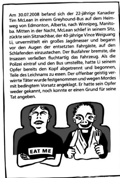
Abb. 2 und 3: Vorder- und Rückseite ›Kopflös durch die Nacht‹

Im Vergleich zu der Auflösung des fiktionalen Krimirätsels zeigen sich hier zahlreiche Unterschiede: Die ›gut recherchierte‹ und im Stil eines Zeitungsberichts präsentierte Auflösung des real crime -Rätsels spart nicht mit Details. Nicht nur die Tat an sich, sondern auch das strafrechtliche Schicksal des Täters und das Verhalten von Busfahrer, Fahrgästen und Polizei werden beschrieben. Der Zusammenhang zwischen Aktion (Wahl des Transportmittels) und Konsequenz (Tod) wird hingegen durch die Erklärung nicht herbeigeführt; anders als im fiktiven Fall, in dem die