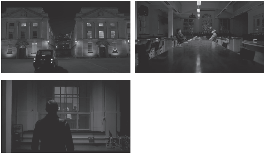
Abb. 3–5: Filmische Visualisierung von (falschen) Entscheidungen (TC 01:07:27, 01:09:41 und 01:19:51).

der Ereignisse durch eine unvorhersehbare Handlung aufbricht, entlarvt er für das Publikum das Streben nach der lückenlosen Erkenntnis und der Unabhängigkeit vom Zufall als unproduktiven Ego-Trip.