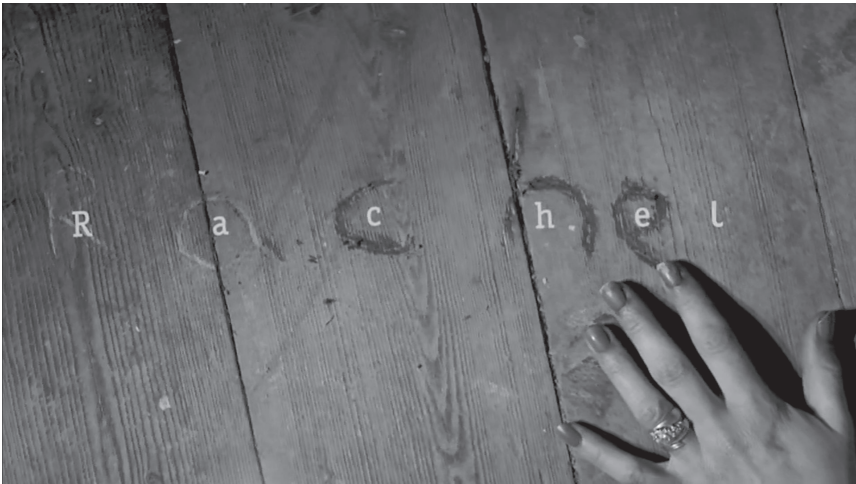
Abb. 1 und 2: Affekt- und Wahrnehmungsbilder im Rahmen der Ermittlungssequenz (TC 24:42 und 24:45).

Die für den Fall entscheidenden Informationen werden als Schriftinserts eingeblendet, wobei die Bewegung der Buchstaben, die sich erst zu Worten ordnen, den kognitiven Prozess des Detektivs als quasi-maschinelle Berechnung visualisiert und insofern an Conan Doyles Charakterisierung von Holmes als »calculating machine« in The Sign of Four (SH 96) erinnert. Die Phase des Sehens und Identifizierens geht nahtlos in eine (sehr