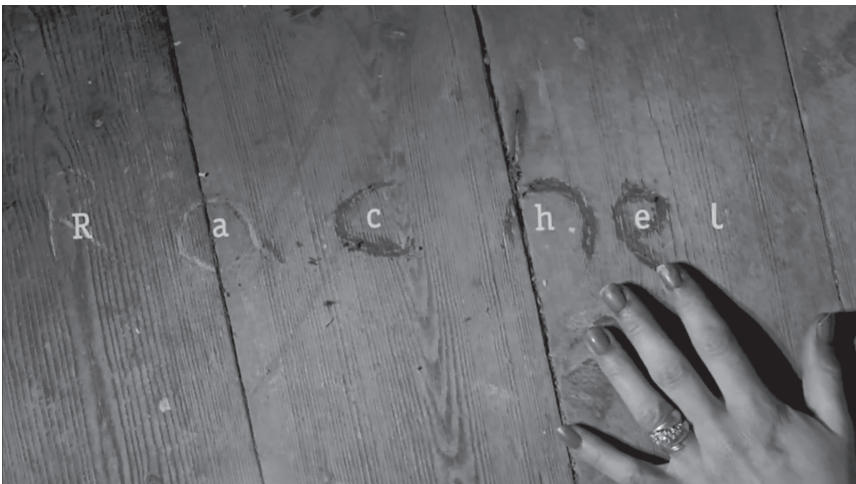
Abb. 1 und 2: Affekt- und Wahrnehmungsbilder im Rahmen der Ermittlungssequenz (TC 24:42 und 24:45).

Die für den Fall entscheidenden Informationen werden als Schriftinserts eingeblendet, wobei die Bewegung der Buchstaben, die sich erst zu Worten ordnen, den kognitiven Prozess des Detektivs als quasi-maschinelle Berechnung visualisiert und insofern an Conan Doyles Charakterisierung von Holmes als »calculating machine« in The Sign of Four (SH 96) erinnert. Die Phase des Sehens und Identifizierens geht nahtlos in eine (sehr