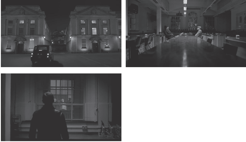
Abb. 3–5: Filmische Visualisierung von (falschen) Entscheidungen (TC 01:07:27, 01:09:41 und 01:19:51).

der Ereignisse durch eine unvorhersehbare Handlung aufbricht, entlarvt er für das Publikum das Streben nach der lückenlosen Erkenntnis und der Unabhängigkeit vom Zufall als unproduktiven Ego-Trip.