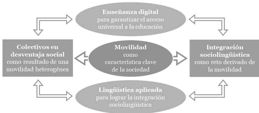
Figura 2: Organización de las acciones de los proyectos elaborados.

Como conclusión de lo dicho hasta aquí mostramos cómo los elementos presentados entran en relación y configuran un todo indivisible, que constituye el eje de trabajo de nuestro equipo de investigación y que surge motivado por los desafíos sociolingüísticos que emanan de este contexto: