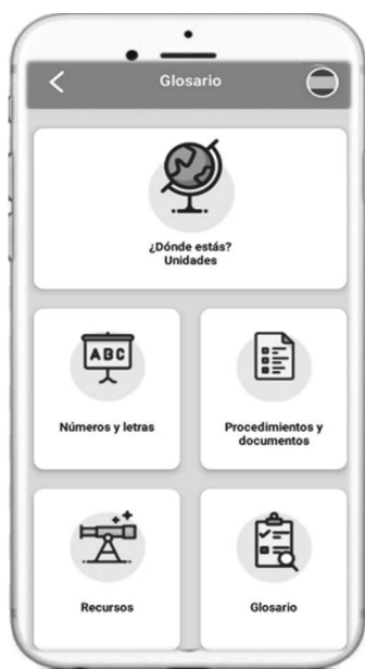
Figura 8: Funcionalidades

to que se entiende que el aprendiz no posee aún los rudimentos básicos del idioma, pero necesita manejar determinados aspectos gramaticales y léxicos que, aunque se enmarcan en un nivel superior, son necesarios para que el usuario pueda desarrollar con éxito los intercambios comunicativos que puedan surgir al llegar a la sociedad de acogida. Por esta razón, 7Ling se aleja de las aplicaciones de enseñanza de idiomas al uso, y toma como punto de partida seis situaciones comunicativas a las que el recién llegado tendrá que enfrentarse: desenvolverse en las primeras interacciones tras la llegada a la nueva sociedad, desplazarse por la ciudad y localizar lugares de interés, adquirir productos y familiarizarse con los principales establecimientos, buscar alojamiento, buscar empleo y acudir al médico.