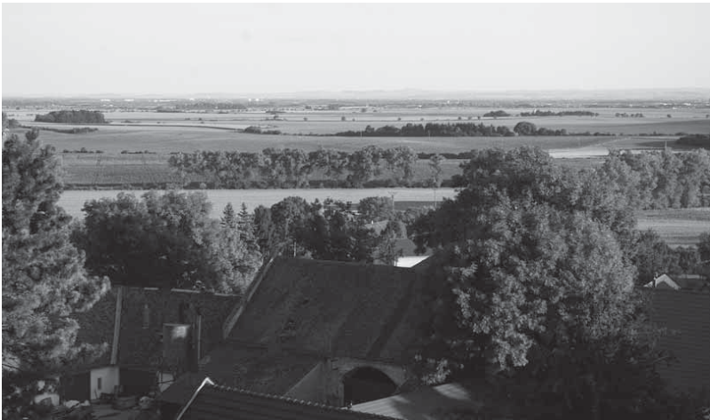
Abb. 4b: Schloss Lautschin, Blick von der Terrasse