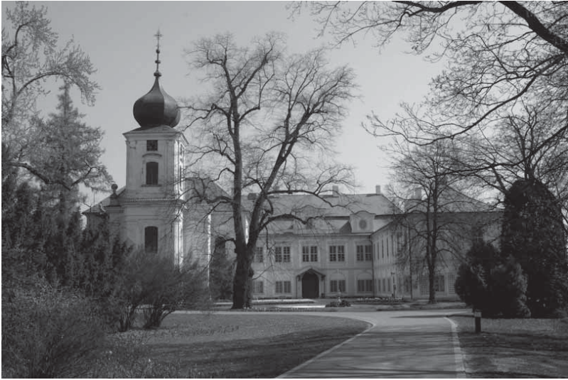
Abb. 4a: Schloss Lautschin (Zamek Loučeň/Lautschin)