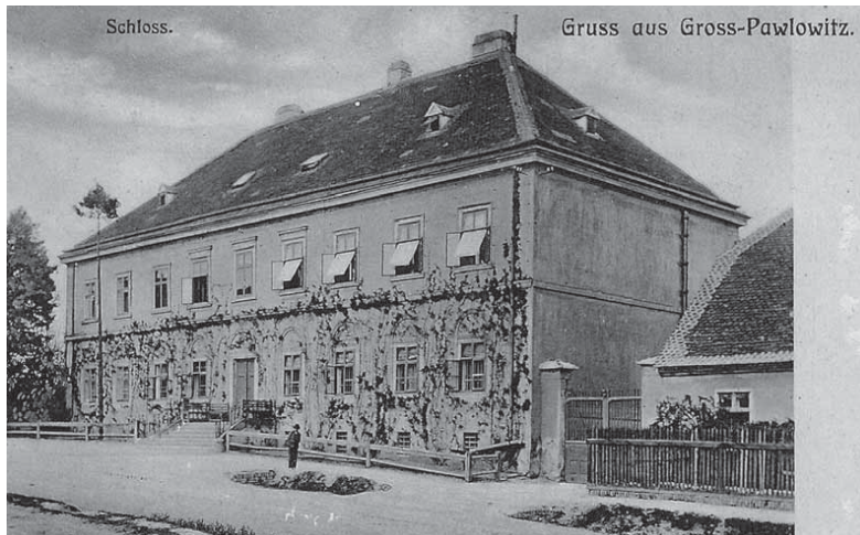
Abb. 8: Groß-Pawlowitz: Rudolf Kassners Geburts- und Elternhaus