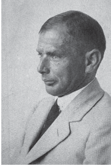
Abb. 5: Rudolf Kassner (um 1920; Privatsammlung Stuttgart)