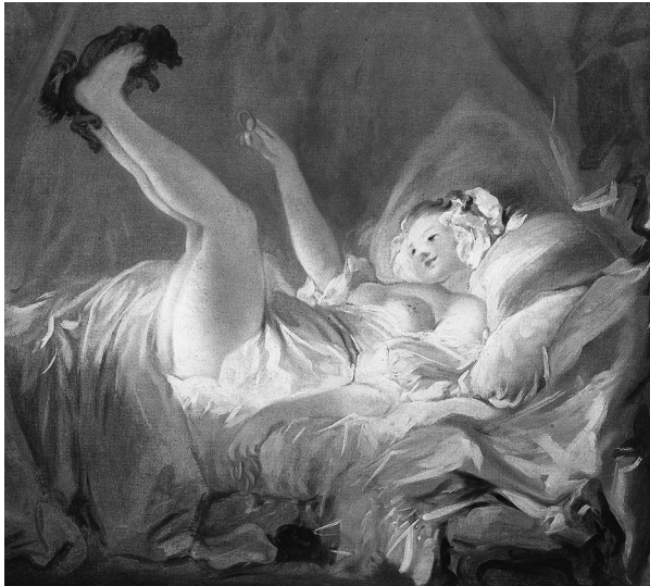
Abb. 2: Jean-Honoré Fragonard, Jeune fille faisant jouer son chien dans son lit (ca. 1770)