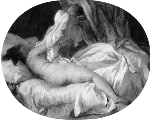
Abb. 1: Jean-Honoré Fragonard, La Chemise enlevée (ca. 1770)

der Farbspiegelungen im Wasser besonders geeignet machte – hierfür wären wohl die von Rilke geschätzten Impressionisten einschlägig. Das Weiß und die Röte, mit denen Fragonard sich beschäftigt, sind das Weiß und die Röte der nackten Frauenhaut: