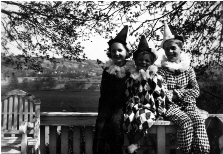
Abb. 8: Die Kinder Mila Esslingers als Pierrots