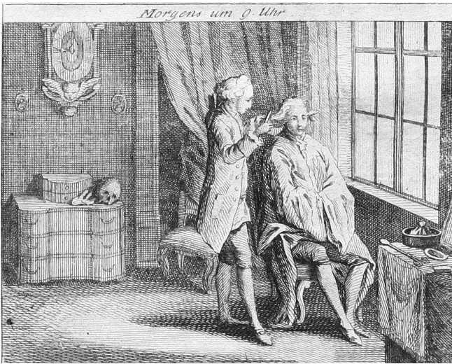
Abb. 1 Morgens um 9 Uhr, Kupferstich, 5,4 x 6,9 cm 21

Am Folgetag wird die skizzierte Bilanz schriftlich nachbereitet: