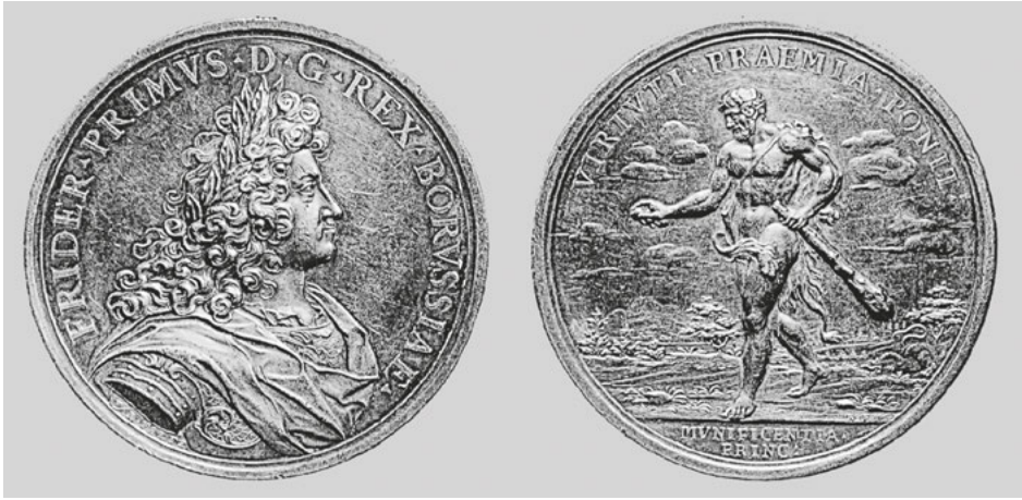
Abb. 63: Raimund Faltz, Preismedaille der Akademie der Künste und mechanischen Wissenschaften , Silber, 1701, Potsdam, SPSG, Dohna V, 177.

Noch stärker in Zusammenbindung von Friedrich I. und der Kunstakademie durch Vorder- und Rückseite gestaltete Christian Wermuth eine Medaille, die 1701 anlässlich des fünften Jahrestages der Akademiegründung geschaffen und dem König gewidmet wurde. Dieser ist in zeitgenössischer Rüstung auf dem Avers in Bezug zur Akademie gesetzt, während das Revers mit der Inschrift „Pvblīcae felicitatis monumentvm“ einen deutlichen Hinweis auf das durch den Herrscher wie die Künstler begründete Staatswohl gestaltet (Abb. 64). 36 Vor dem Prospekt des Marstalls auf der Dorotheenstraße, wo die Kunstakademie ihren Sitz hatte, steht Felicitas mit Füllhorn – den kulturellen Früchten der Akademie –, an ihrer Seite drei Putti mit den Attributen der bildenden Künste. Die 1694 gegründete Akademie bzw. Universität in Halle, die Fridericiana, ehrt ihren Stifter Friedrich III. mit demselben Porträtkopf (allerdings ohne Lorbeerkranz) auf dem Avers und den sich über einem rauchenden Altar die Hände reichenden Figuren von Mars und Minerva auf dem Revers. 37 Sie besiegeln Friedrichs Tat bzw. den Wunsch nach seinem dauerhaften Schutz, wie es auch die Inschrift „FELICITATI TEMPORVM“ (Glückliche Zeiten) anzeigt (Abb. 65).