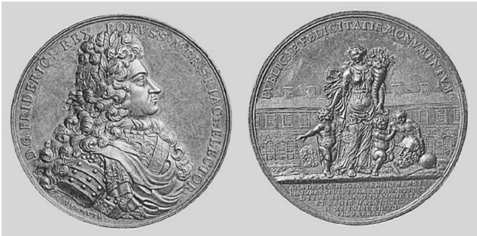
Abb. 64: Christian Wermuth, Medaille auf den 5. Gründungstag der Akademie der Künste, Bronze, 1701, Potsdam, SPSPG, Dohna V, 176.