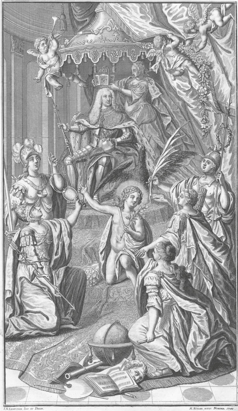
Abb. 60: M. Rösler, Frontispiz der Wahl- und Krönungsakten Kaiser Karls VII., Kupferstich, Frankfurt am Main, 1742.