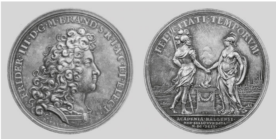
Abb. 65: Raimund Faltz, Medaille der Akademie bzw. Universität in Halle, Fridericiana, auf ihren Stifter Friedrich III., Silber, 1694, Berlin, Staatliche Museen, Münzkabinett.

1763 Apoll im Strahlenkranz auf Wolken über einer Flusslandschaft mit den Flussgöttern Rhein und Neckar (Abb. 66). 38 Das Zusammenwirken dieser Götter wird durch die Umschrift als „glückliche Vereinigung“ bezeichnet und somit das Musenreich in die Lande Carl Theodors transferiert, der als Profilbildnis – in Rüstung mit Fellmantel und Perücke – das Avers einnimmt. Die zwei getrennten Bilder des Kurfürsten – als Staatsmann und in Verkörperung seines Wesens durch