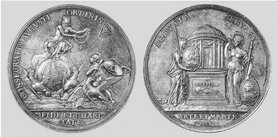
Abb. 62: Christian Wermuth, Medaille auf die Ernennung des Kronprinzen Friedrich Wilhelm zum Ritter des Schwarzen Adlerordens, Silber, 1706, Berlin, SMB PK, Münzkabinett.

Rundtempels. Die lateinische Umschrift ist zu übersetzen: „Wir werden gerettet, wenn sie wohlbehalten ist“, 33 die Bildinschrift ergänzt diese Formel mit der bekannten Setzung von Arte et Marte . Minervas Schlüssel deutet die Erbfolge des preußischen Kronprinzen an, wie auch der Rundtempel für die Unendlichkeit steht, verweist aber auch auf die Schlüsselgewalt über die Bewahrung der Ordensregeln, die mit der Palme in der Mitte des Tempels im Sinne von „Triumph und Glorie des stoischen Gemütes“ 34 versinnbildlicht werden.