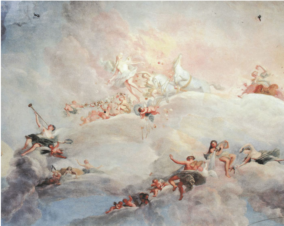
Abb. 68: Antoine Pesne, Ganymed wird von Hebe im Olymp empfangen , Deckengemälde im Festsaal (Detail), 1740, Rheinsberg, Schloss.

zitiert, so Matthias Winner: Sie solle „die wilden Werke des Krieges auf Meeren und Ländern“ einschlummern und zum „ruhigen Frieden“ verhelfen. 80