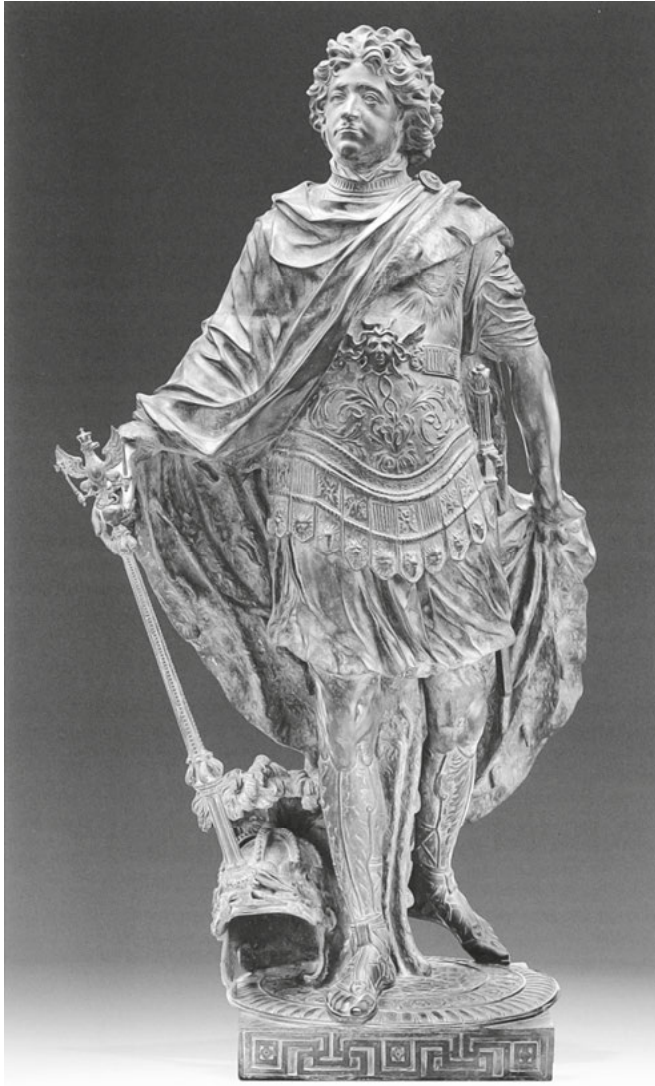
Abb. 67: Andreas Schlüter, Kurfürst Friedrich III. , Bronze, 1698 (Original verschollen), Berlin, Schloss Charlottenburg vor dem Knobelsdorff-Flügel.

Zudem war vor Ort im Lustgarten des Berliner Schlosses eine vergoldete Bleikopie des Apoll von Jacques Vigneroles aufgestellt, wie aus einer Beschreibung 1657 zu ersehen ist. 64