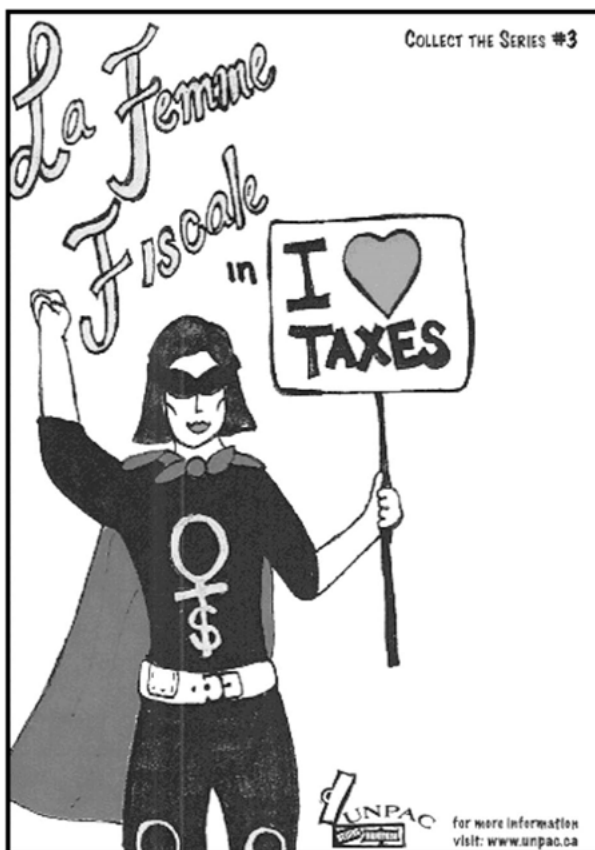
Abb. 1: Postkartenserie zur Kampagne „I love taxes“ (Ausschnitt)

Im Zentrum der Kampagne stand die „Femme Fiscale“, eine Superheldin, die wichtige Themen der Kampagne verkörperte und öffentlichkeitswirksam eingesetzt werden konnte. Zum einen schlüpfen reale Personen in die Rolle der Femme Fiscale und erscheinen beispielsweise zu einem Treffen mit dem Finanzminister, bei dem ein Forderungskatalog von Frauen zur Budgetpolitik übergeben wurde. Derartige Aktionen erzeugten Medieninteresse und lösten rege Diskussionen aus. Die Femme Fiscale existiert aber auch als Cartoon-Figur (vgl. Abb. 1) und trägt beispielsweise als Protagonistin in einer Postkartenserie dazu bei, möglichst anschaulich zu erklären, welche Bedeutung einzelne Ausgabenbereiche wie etwa öffentlicher Verkehr, Kinderbetreuungsplätze und sozialer Wohnbau für Frauen haben und warum Steuern insbesondere für Frauen wichtig sind.