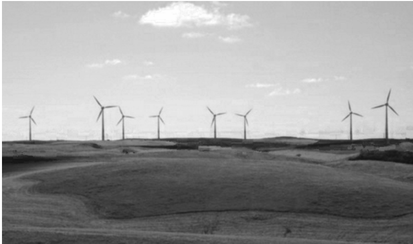
Abb. 2: Windkraftanlage am Horizont