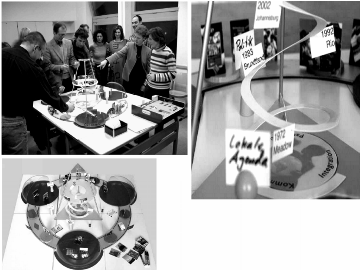
Abb. 2: Arbeit mit dem Nachhaltigkeitskoffer a

a – Die Bilder sind im Unterricht bei Anja Grothe an der HWR entstanden.