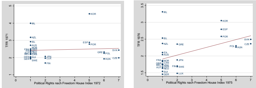
Abbildung 5-22: Zusammenhang politische Rechte und TFR 1971 und 1976

Quelle: Eigene Berechnungen auf Basis von Freedom House 2009, OECD 2008a, SBA 2008c.