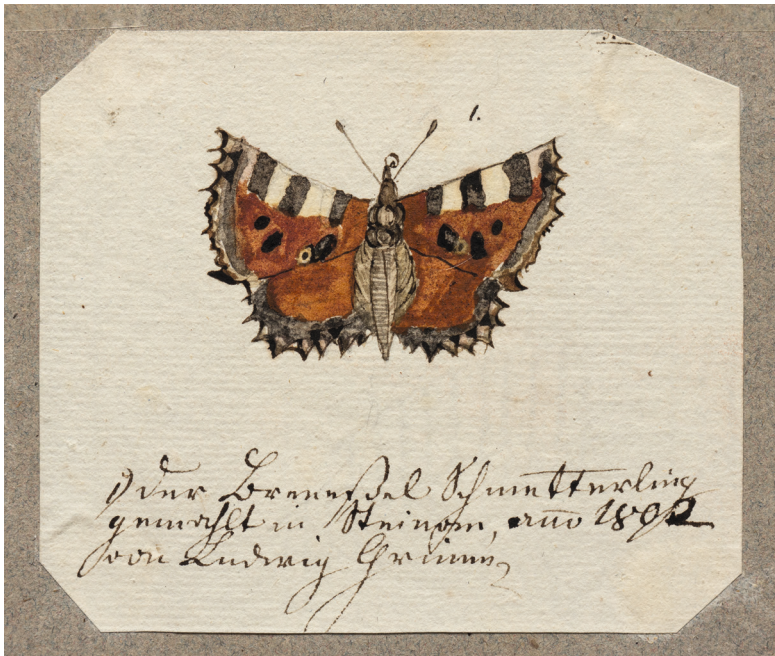
Abb. 5: Ludwig Emil Grimm, Schmetterling (Pfaueauge), 1802 © Grimm-Sammlung der Stadt Kassel, Hz. 555.

Die Zeichnungen von Ludwig Emil Grimm geben mit Naturstudien, Dokumentationen des Lebens der Familie Grimm sowie auch frühen Karikaturen einen Vorausblick auf sein späteres künstlerisches Schaffen (Abb. 4). Ein weiteres Konvolut umfasst die Zeichnungen der „Grimm-Kinder“ mit Abbildungen von Tieren, Personen aus der Familie und ihrem persönlichen Umfeld sowie Skizzenbücher. Dokumentiert sind so mit Ludwig Emil Grimm und Carl Hassenpflug gleich zwei spätere Künstler aus zwei Generationen, sowie mit Ideke und Herman Grimm zwei „Laien“ aus der Generation der „Grimm-Kinder“. Deutlich wird hierbei der familiäre Einfluss: Die Brüder Grimm und ihre Geschwister zeichneten regelmäßig. Sowohl Intensität als auch Qualität überraschen dabei, da sie weitestgehend keinen Zeichenunterricht hatten. Sie erlangten ihr Können in jungen Jahren jedoch vor allem durch eine disziplinierte „Kultur des Abzeichnens“ (Abb. 5).