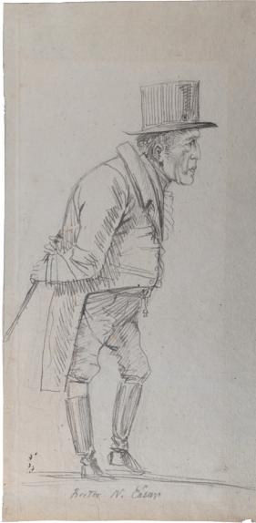
Abb. 4: Ludwig Emil Grimm: Rektor Nathanael Cäsar, vermutlich 1806 © Grimm- Sammlung der Stadt Kassel, Hz. 270.

Die Zeichnungen von Ludwig Emil Grimm geben mit Naturstudien, Dokumentationen des Lebens der Familie Grimm sowie auch frühen Karikaturen einen Vorausblick auf sein späteres künstlerisches Schaffen (Abb. 4). Ein weiteres Konvolut umfasst die Zeichnungen der „Grimm-Kinder“ mit Abbildungen von Tieren, Personen aus der Familie und ihrem persönlichen Umfeld sowie Skizzenbücher. Dokumentiert sind so mit Ludwig Emil Grimm und Carl Hassenpflug gleich zwei spätere Künstler aus zwei Generationen, sowie mit Ideke und Herman Grimm zwei „Laien“ aus der Generation der „Grimm-Kinder“. Deutlich wird hierbei der familiäre Einfluss: Die Brüder Grimm und ihre Geschwister zeichneten regelmäßig. Sowohl Intensität als auch Qualität überraschen dabei, da sie weitestgehend keinen Zeichenunterricht hatten. Sie erlangten ihr Können in jungen Jahren jedoch vor allem durch eine disziplinierte „Kultur des Abzeichnens“ (Abb. 5).