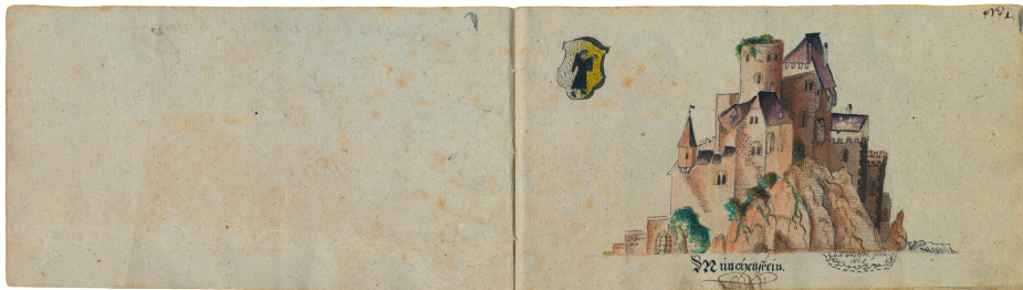
Abb. 3: Ludwig Emil Grimm, Skizzenbuch, 1805, S. 4