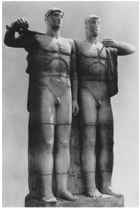
1 Sepp Mages, „Sportkameraden“ (Modell) 1936 Sepp Mages, Sports Comrades (model) 1936

Künstler Sepp Mages Aufstellung 1936 Höhe 6,15 m mit Postament Material Muschelkalk Artist Sepp Mages erected 1936 Height 6.15 m with pedestal Material shell limestone