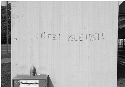
Abb. 11: Nordwestliches Treppenhaus von Parkhaus 3 (Außenwand).

Ein ähnliches Muster zeichnete sich für das Campusgelände ab. Auch hier konzentrierten sich die Funde überwiegend auf die viel genutzten Verkehrswege, einschließlich der Stadtbahn-Haltestelle sowie der Parkhäuser. Im Innenraum des X-Gebäudes, das immerhin schon fast zehn Jahre in Betrieb ist, finden sich hingegen auffällig wenige Graffiti und Sticker. Die Karten (Abb. 12 und 13) geben einen Überblick über die Fundorte derjenigen Motive, die später in der Ausstellung gezeigt wurden. Insgesamt wuchs die Dokumentation bis zum Abschluss der Foto-Phase auf 530 Bilder von knapp ebenso vielen einzelnen Funden an. Während der zwei Wochen war es mir gelungen, die Örtlichkeiten anhand der zuvor erstellten Listen im Großen und Ganzen planmäßig