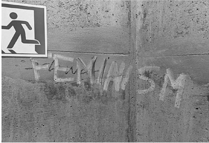
Abb. 10: UHG, Treppenturm D, Ebene 2.

Treppentürmen auf den zwei bis drei Ebenen ober- und unterhalb der Haupthalle sowie im jeweils obersten Stockwerk direkt unter dem Dach verortet sind. Hinzu kamen die an die Halle angrenzenden Flure und Treppenaufgänge und nicht zuletzt die Haupthalle selbst, die teilweise eine beträchtliche Dichte nicht nur an Graffiti, sondern gerade auch an Stickern aufweist. Angesichts der engen Zeitplanung ließ ich bald die sich als wenig ertragreich herausstellenden Bürokorridore in den oberen Etagen aus.