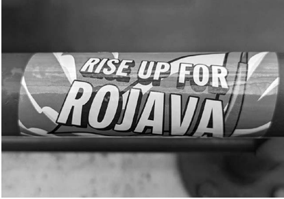
Abb. 5: UHG, Haupthalle, Galerie D1.

Platz im Studienalltag findet. Explizit verstanden als Leseweche , soll sie Freiheiten ermöglichen, Interessen jenseits der planmäßigen Studieninhalte zu verfolgen. Außerdem können nicht nur Lehrende, sondern auch Studierende Vorschläge für Veranstaltungen machen, die dann in dieser Woche stattfinden können.