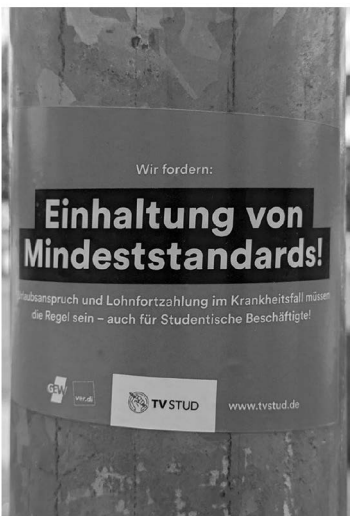
Abb. 4: Universitätsstraße.

Nach einigen Sondierungen im Vorfeld begann die Planungs-Phase damit, dass ich Listen für die spätere systematische Abarbeitung beim Fotografieren erstellte. Anhand der auf der Homepage der Universität Bielefeld bereitgestellten Karten und Lagepläne des Campus und des Hauptgebäudes (UHG) notierte ich die Örtlichkeiten (Gebäudeteile, Wege, Straßen, Parkhäuser usw.), die später Schritt für Schritt abgesucht werden sollten. Ferner legte ich das Druckformat für die Fotografien, die ich für die Ausstellung verwenden wollte, fest und sah mich nach Möglichkeiten, die Drucke anfertigen zu lassen, um.