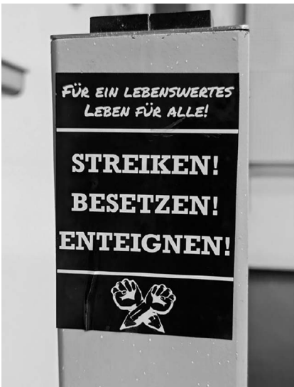
Abb. 6: UHG, Hörsaal 1.

und Raumvorschlägen seitens der Organisator*innen. Der Titel der Veranstaltung sollte lauten: „See the Unseen‘ – Interaktive Ausstellung zu politischen Graffitis“. Bei „See the Unseen“ handelt es sich um das Zitat eines Graffitis, auf das ich gleich zu Beginn der Foto-Phase gestoßen war.