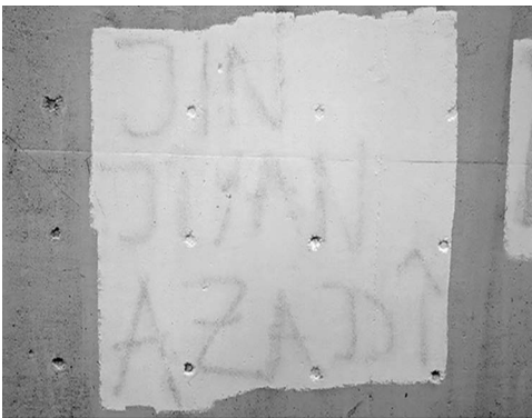
Abb. 3: Unter der Farbe erkennbares Graffiti an der Rampe neben dem Haupteingang des UHG.

Das Erstellen eines sol- chen Korpus an Fotografien von Graffitis und Stickern in den Gebäuden und auf dem Gelände der Universität Bielefeld beinhaltet schließlich einen dokumentarischen Aspekt. Insbesondere vor dem Hintergrund der fort- schreitenden Renovierungs- arbeiten am Hauptgebäude (UHG) ist absehbar, dass diese Ausdrücke des politi- schen Lebens an der Univer- sität nicht ewig erhalten blei- ben werden. Darüber hinaus ‚verschwinden‘ Graffitis und Sticker auch im alltäglichen Universitätsbetrieb, nicht zu- letzt aufgrund von Praktiken des aktiven Entfernens oder Zerstörens. Anschaulichstes Beispiel in dieser Hinsicht ist die Brücke, die den Haupt- eingang des UHG mit der Stadt- bahn-Haltestelle verbind- et. Auf deren wandartige Geländer geschriebene (ge- rade auch politische) Graffi- tis werden regelmäßig mit Farbe überstrichen und so unkenntlich gemacht