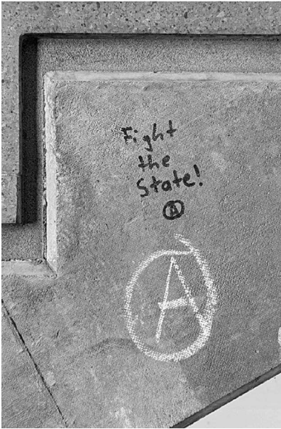
Abb. 8: UHG, Treppenturm BLC, Ebene 4.

Symbolen. (Letzteres fehlt interessanterweise bei den Stickern beinahe völlig, was aktivere Praktiken des Entfernens und Überklebens vermuten lässt.) Von besonderem Interesse für mein Projekt waren dabei solche Graffiti, die nachträgliche Veränderungen und Hinzufügungen, sprich eine (konfliktvolle) Interaktion zwischen unterschiedlichen Autor*innen, aufweisen (Graffiti-Beispiele: Abb. 7 bis 11).