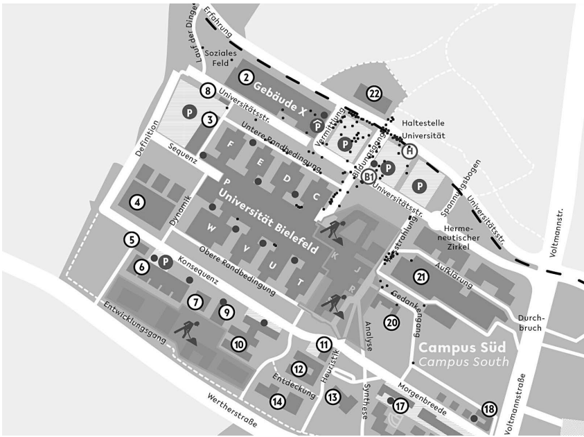
Abb. 12: Karte der Fundorte – Campus.