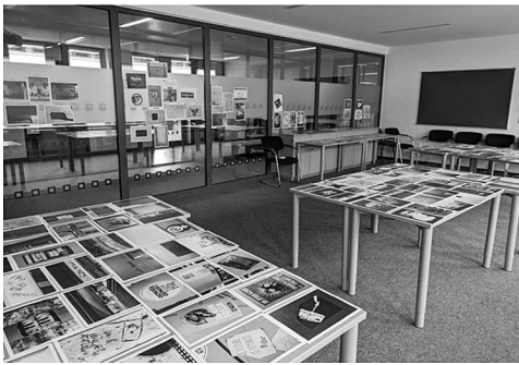
Abb. 14: Die Ausstellung am 30. Mai in X-B2-103.

dauerte bis weit nachdem die ersten Besucher*innen bereits eingetroffen waren. Mein Versuch, die Besucher*innen in das Verteilen der Drucke einzubinden, wurde nur mäßig angenommen. Da nach und nach Einzelne oder Zweier- oder Dreier-Grüppchen vorbeikamen, war nie viel Publikum gleichzeitig vor Ort. Das Aufkommen fächerte sich über beinahe den gesamten Ausstellungszeitraum auf, jedoch blieb die Anzahl der Besucher*innen insgesamt überschaubar. Die leicht abgelegene Lage des Raums machte sich in der geringen Menge der zufälligen Passant*innen bemerkbar. Für eine Veranstaltung der Leseweche war die Ausstellung dennoch in der Summe sogar überdurchschnittlich gut besucht.