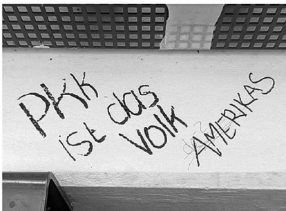
Abb. 9: UHG, Haupthalle, Galerie C1.

Symbolen. (Letzteres fehlt interessanterweise bei den Stickern beinahe völlig, was aktivere Praktiken des Entfernens und Überklebens vermuten lässt.) Von besonderem Interesse für mein Projekt waren dabei solche Graffiti, die nachträgliche Veränderungen und Hinzufügungen, sprich eine (konfliktvolle) Interaktion zwischen unterschiedlichen Autor*innen, aufweisen (Graffiti-Beispiele: Abb. 7 bis 11).