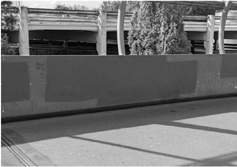
Abb. 2: Brückengeländer mit Flächen neuer Farbe, die u.a. „Jin, Jiyan, Azadi“-Graffitis aus dem vorangegangenen Semester überdecken.

im Sinne eines radikal-demokratischen Verständnisses, demzufolge solche Praktiken Demokratie überhaupt erst ausmachen (vgl. Flügel-Martinsen 2020: 123). Allerdings können Graffitis und Sticker auch explizit antide-mokratische, wie eben zum Beispiel rechtsextreme, Ausrichtungen auf-weisen. Nicht alle sich hier abzeichnenden Konflikte zwischen verschie- denen Ideen der Gestaltung gesellschaftlicher Ordnung und eventuell damit verbundenen politischen Projekten sind demnach per se als de- mokratisch einzustufen (vgl. ebd.: 108f.).