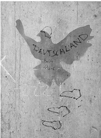
Abb. 7: UHG, Treppenturm VV, Ebene 2.

Mögliche alternative Wege zur Realisierung der Ausstellung, die zu diesem Zeitpunkt noch im Raum standen, aber nur vage konzipiert waren, sollten sich schnell erübrigen. Denn innerhalb weniger Tage erhielt ich eine positive Rückmeldung seitens des Organisationsteams, gefolgt von der Zusage für einen Termin am 30. Mai, dem ersten Tag der Leseweche, sowie für einen Raum im X-Gebäude. Aufgrund von Größe, Ausstattung und vor allem der zum Flur hin liegenden großen Glasfensterfront, die sich hervorragend als Ausstellungsfläche eignen würde, versprach der reservierte Raum gute Chancen, die Ausstellung der Konzeption entsprechend verwirklichen zu können. Allerdings bedeutete die Wahrnehmung des Angebots der Leseweche auch, dass es im absehbaren Rahmen dieses Projekts bei einem einmaligen Termin bleiben würde.