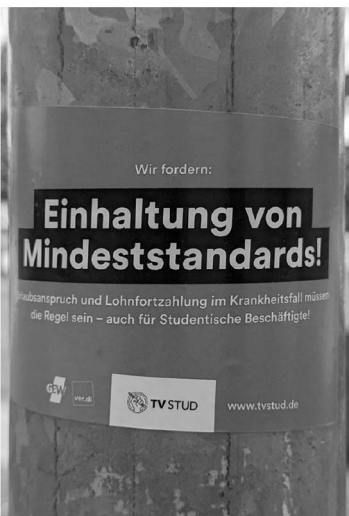
Abb. 4: Universitätsstraße.

Die praktische Umsetzung des Projekts erfolgte innerhalb eines Monats, im Mai 2023, und lief in drei Phasen ab, die sich teilweise zeitlich überschneiden: Während der Planungs-Phase in den ersten beiden Mai-Wochen arbeitete ich das Ausstellungskonzept genauer aus, organisierte einen Termin für die Realisierung der Ausstellung in der Universität und passte daraufhin die Zeitplanung für den weiteren Verlauf des Projekts an. Die Foto-Phase, in der ich den Universitätscampus nach relevanten Fotomotiven durchforstete, dauerte vom 5. bis zum 19. Mai. Die finale Ausstellungs-Phase startete ich schon am 17. Mai mit dem Beginn der Vorbereitungsarbeiten für die Ausstellung, deren Durchführung am 30. Mai den Abschluss des Projekts markierte.