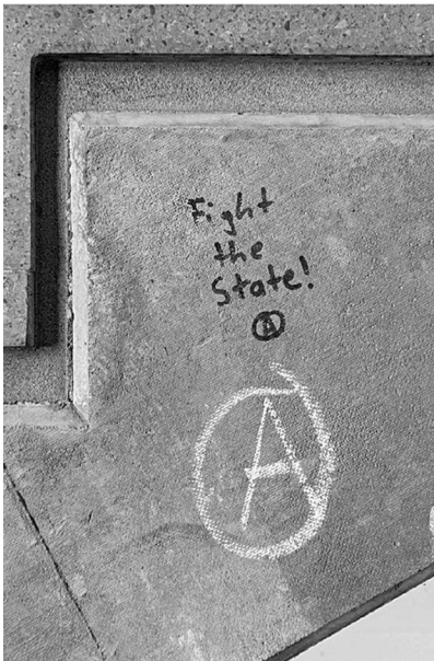
Abb. 8: UHG, Treppenturm BLC, Ebene 4.

Symbolen. (Letzteres fehlt interessanterweise bei den Stickern beinahe völlig, was aktivere Praktiken des Entfernens und Überklebens vermuten lässt.) Von besonderem Interesse für mein Projekt waren dabei solche Graffiti, die nachträgliche Veränderungen und Hinzufügungen, sprich eine (konflikthafte) Interaktion zwischen unterschiedlichen Autor*innen, aufweisen (Graffiti-Beispiele: Abb. 7 bis 11).