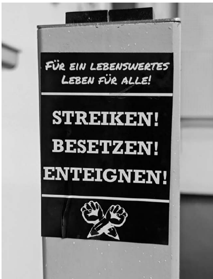
Abb. 6: UHG, Hörsaal 1.

und Raumvorschlägen seitens der Organisator*innen. Der Titel der Veranstaltung sollte lauten: „See the Unseen‘ – Interaktive Ausstellung zu politischen Graffitis“. Bei „See the Unseen“ handelt es sich um das Zitat eines Graffitis, auf das ich gleich zu Beginn der Foto-Phase gestoßen war.