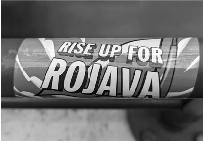
Abb. 5: UHG, Haupthalle, Galerie D1.

Platz im Studienalltag findet. Explizit verstanden als Leseweche , soll sie Freiheiten ermöglichen, Interessen jenseits der planmäßigen Studieninhalte zu verfolgen. Außerdem können nicht nur Lehrende, sondern auch Studierende Vorschläge für Veranstaltungen machen, die dann in dieser Woche stattfinden können.