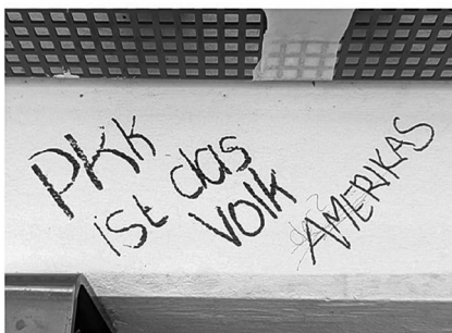
Abb. 9: UHG, Haupthalle, Galerie C1.

Symbolen. (Letzteres fehlt interessanterweise bei den Stickern beinahe völlig, was aktivere Praktiken des Entfernens und Überklebens vermuten lässt.) Von besonderem Interesse für mein Projekt waren dabei solche Graffiti, die nachträgliche Veränderungen und Hinzufügungen, sprich eine (konflikthafte) Interaktion zwischen unterschiedlichen Autor*innen, aufweisen (Graffiti-Beispiele: Abb. 7 bis 11).