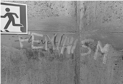
Abb. 10: UHG, Treppenturm D, Ebene 2.

Treppentürmen auf den zwei bis drei Ebenen ober- und unterhalb der Haupthalle sowie im jeweils obersten Stockwerk direkt unter dem Dach verortet sind. Hinzu kamen die an die Halle angrenzenden Flure und Treppenaufgänge und nicht zuletzt die Haupthalle selbst, die teilweise eine beträchtliche Dichte nicht nur an Graffitis, sondern gerade auch an Stickern aufweist. Angesichts der engen Zeitplanung ließ ich bald die sich als wenig ertragreich herausstellenden Bürokorridore in den oberen Etagen aus.