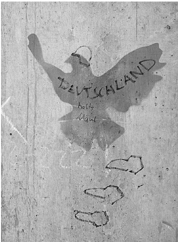
Abb. 7: UHG, Treppenturm VV, Ebene 2.

Mögliche alternative Wege zur Realisierung der Ausstellung, die zu diesem Zeitpunkt noch im Raum standen, aber nur vage konzipiert waren, sollten sich schnell erübrigen. Denn innerhalb weniger Tage erhielt ich eine positive Rückmeldung seitens des Organisationsteams, gefolgt von der Zusage für einen Termin am 30. Mai, dem ersten Tag der Leseweche, sowie für einen Raum im X-Gebäude. Aufgrund von Größe, Ausstattung und vor allem der zum Flur hin liegenden großen Glasfensterfront, die sich hervorragend als Ausstellungsfläche eignen würde, versprach der reservierte Raum gute Chancen, die Ausstellung der Konzeption entsprechend verwirklichen zu können. Allerdings bedeutete die Wahrnehmung des Angebots der Leseweche auch, dass es im absehbaren Rahmen dieses Projekts bei einem einmaligen Termin bleiben würde.