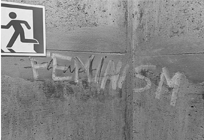
Abb. 10: UHG, Treppenturm D, Ebene 2.

Treppentürmen auf den zwei bis drei Ebenen ober- und unterhalb der Haupthalle sowie im jeweils obersten Stockwerk direkt unter dem Dach verortet sind. Hinzu kamen die an die Halle angrenzenden Flure und Treppenaufgänge und nicht zuletzt die Haupthalle selbst, die teilweise eine beträchtliche Dichte nicht nur an Graffiti, sondern gerade auch an Stickern aufweist. Angesichts der engen Zeitplanung ließ ich bald die sich als wenig ertragreich herausstellenden Bürokorridore in den oberen Etagen aus.