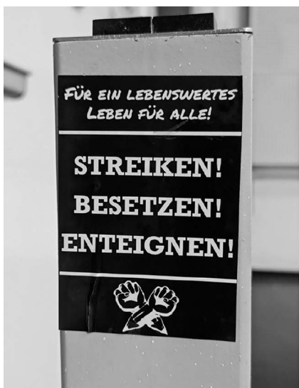
Abb. 6: UHG, Hörsaal 1.

Mit der Leseweche besteht also bereits ein institutionalisiertes Angebot innerhalb der Universität, das Gestaltungsmöglichkeiten auch für Studierende zu bieten verheißt. Inwieweit dies auch der Wirklichkeit entspricht, galt es nun zu erkunden. Die Entscheidung, zu versuchen mein Projekt im Rahmen der Leseweche umzusetzen, traf ich jedoch nicht zuletzt auch mit der Aussicht auf Zugang zu institutionellen Ressourcen: insbesondere eine Räumlichkeit für die Ausstellung, eine Platzierung im offiziellen Veranstaltungsprogramm der Leseweche sowie technische Ressourcen, wie zum Beispiel einen Beamer; allesamt Elemente, die zu einer erfolgreichen Umsetzung der Ausstellung erheblich beitragen würden. Aber gerade die Verfügbarkeit eines geeigneten Raums erwartete ich als größtes mögliches Hindernis für die Realisierung meines Vorhabens. Daher zeigte ich mich bei der Einreichung meines Ausstellungskonzepts als Veranstaltungsvorschlag betont offen gegenüber Termin-