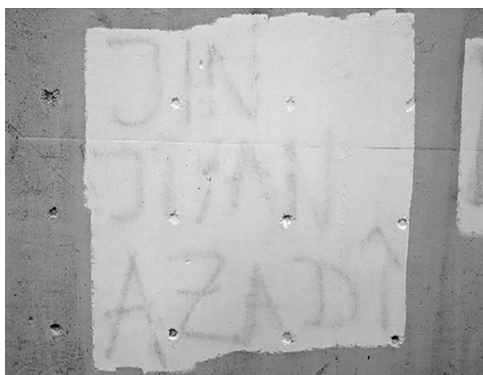
Abb. 3: Unter der Farbe erkennbares Graffiti an der Rampe neben dem Haupteingang des UHG.

Das Erstellen eines sol- chen Korpus an Fotografien von Graffitis und Stickern in den Gebäuden und auf dem Gelände der Universität Bielefeld beinhaltet schließ- lich einen dokumentarischen Aspekt. Insbesondere vor dem Hintergrund der fort- schreitenden Renovierungs- arbeiten am Hauptgebäude (UHG) ist absehbar, dass diese Ausdrücke des politi- schen Lebens an der Univer- sität nicht ewig erhalten blei- ben werden. Darüber hinaus ‚verschwinden‘ Graffitis und Sticker auch im alltäglichen Universitätsbetrieb, nicht zu- letzt aufgrund von Praktiken des aktiven Entfernens oder Zerstörens. Anschaulichstes Beispiel in dieser Hinsicht ist die Brücke, die den Haupt- eingang des UHG mit der Stadtbahn-Haltestelle verbind- et. Auf deren wandartige Geländer geschriebene (ge- rade auch politische) Graffi- tis werden regelmäßig mit Farbe überstrichen und so unkenntlich gemacht