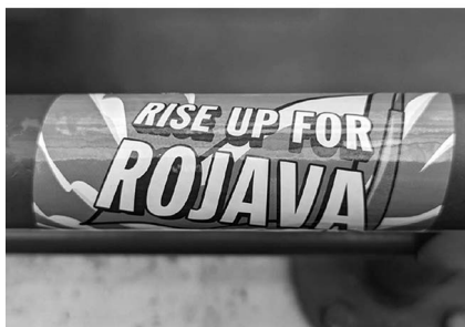
Abb. 5: UHG, Haupthalle, Galerie D1.

Platz im Studienalltag findet. Explizit verstanden als Leseweche , soll sie Freiheiten ermöglichen, Interessen jenseits der planmäßigen Studieninhalte zu verfolgen. Außerdem können nicht nur Lehrende, sondern auch Studierende Vorschläge für Veranstaltungen machen, die dann in dieser Woche stattfinden können.