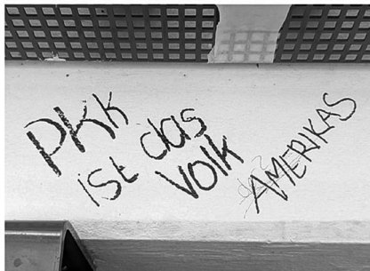
Abb. 9: UHG, Haupthalle, Galerie C1.

Symbolen. (Letzteres fehlt interessanterweise bei den Stickern beinahe völlig, was aktivere Praktiken des Entfernens und Überklebens vermuten lässt.) Von besonderem Interesse für mein Projekt waren dabei solche Graffiti, die nachträgliche Veränderungen und Hinzufügungen, sprich eine (konfliktvolle) Interaktion zwischen unterschiedlichen Autor*innen, aufweisen (Graffiti-Beispiele: Abb. 7 bis 11).