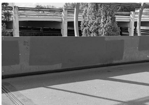
Abb. 2: Brückengeländer mit Flächen neuer Farbe, die u.a. „Jin, Jiyan, Azadi“-Graffitis aus dem vorangegangenen Semester überdecken.

im Sinne eines radikal-demokratischen Verständnisses, demzufolge solche Praktiken Demokratie überhaupt erst ausmachen (vgl. Flügel-Martinsen 2020: 123). Allerdings können Graffitis und Sticker auch explizit antide-mokratische, wie eben zum Beispiel rechtsextreme, Ausrichtungen auf-weisen. Nicht alle sich hier abzeichnenden Konflikte zwischen verschie- denen Ideen der Gestaltung gesellschaftlicher Ordnung und eventuell damit verbundenen politischen Projekten sind demnach per se als de- mokratisch einzustufen (vgl. ebd.: 108f.).