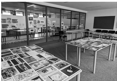
Abb. 14: Die Ausstellung am 30. Mai in X-B2-103.

dauerte bis weit nachdem die ersten Besucher*innen bereits eingetroffen waren. Mein Versuch, die Besucher*innen in das Verteilen der Drucke einzubinden, wurde nur mäßig angenommen. Da nach und nach Einzelne oder Zweier- oder Dreier-Grüppchen vorbeikamen, war nie viel Publikum gleichzeitig vor Ort. Das Aufkommen fächerte sich über beinahe den gesamten Ausstellungszeitraum auf, jedoch blieb die Anzahl der Besucher*innen insgesamt überschaubar. Die leicht abgelegene Lage des Raums machte sich in der geringen Menge der zufälligen Passant*innen bemerkbar. Für eine Veranstaltung der Leseweche war die Ausstellung dennoch in der Summe sogar überdurchschnittlich gut besucht.