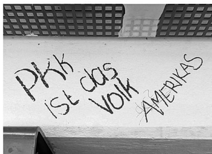
Abb. 9: UHG, Haupthalle, Galerie C1.

Symbolen. (Letzteres fehlt interessanterweise bei den Stickern beinahe völlig, was aktivere Praktiken des Entfernens und Überklebens vermuten lässt.) Von besonderem Interesse für mein Projekt waren dabei solche Graffiti, die nachträgliche Veränderungen und Hinzufügungen, sprich eine (konflikthafte) Interaktion zwischen unterschiedlichen Autor*innen, aufweisen (Graffiti-Beispiele: Abb. 7 bis 11).