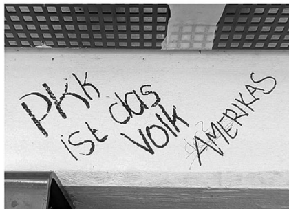
Abb. 9: UHG, Haupthalle, Galerie C1.

Symbolen. (Letzteres fehlt interessanterweise bei den Stickern beinahe völlig, was aktivere Praktiken des Entfernens und Überklebens vermuten lässt.) Von besonderem Interesse für mein Projekt waren dabei solche Graffiti, die nachträgliche Veränderungen und Hinzufügungen, sprich eine (konflikthafte) Interaktion zwischen unterschiedlichen Autor*innen, aufweisen (Graffiti-Beispiele: Abb. 7 bis 11).