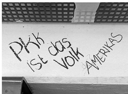
Abb. 9: UHG, Haupthalle, Galerie C1.

Symbolen. (Letzteres fehlt interessanterweise bei den Stickern beinahe völlig, was aktivere Praktiken des Entfernens und Überklebens vermuten lässt.) Von besonderem Interesse für mein Projekt waren dabei solche Graffiti, die nachträgliche Veränderungen und Hinzufügungen, sprich eine (konfliktvolle) Interaktion zwischen unterschiedlichen Autor*innen, aufweisen (Graffiti-Beispiele: Abb. 7 bis 11).