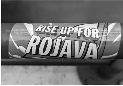
Abb. 5: UHG, Haupthalle, Galerie D1.

Platz im Studienalltag findet. Explizit verstanden als Leseweche , soll sie Freiheiten ermöglichen, Interessen jenseits der planmäßigen Studieninhalte zu verfolgen. Außerdem können nicht nur Lehrende, sondern auch Studierende Vorschläge für Veranstaltungen machen, die dann in dieser Woche stattfinden können.