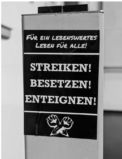
Abb. 6: UHG, Hörsaal 1.

Mit der Leseweche besteht also bereits ein institutionalisiertes Angebot innerhalb der Universität, das Gestaltungsmöglichkeiten auch für Studierende zu bieten verheißt. Inwieweit dies auch der Wirklichkeit entspricht, galt es nun zu erkunden. Die Entscheidung, zu versuchen mein Projekt im Rahmen der Leseweche umzusetzen, traf ich jedoch nicht zuletzt auch mit der Aussicht auf Zugang zu institutionellen Ressourcen: insbesondere eine Räumlichkeit für die Ausstellung, eine Platzierung im offiziellen Veranstaltungsprogramm der Leseweche sowie technische Ressourcen, wie zum Beispiel einen Beamer; allesamt Elemente, die zu einer erfolgreichen Umsetzung der Ausstellung erheblich beitragen würden. Aber gerade die Verfügbarkeit eines geeigneten Raums erwartete ich als größtes mögliches Hindernis für die Realisierung meines Vorhabens. Daher zeigte ich mich bei der Einreichung meines Ausstellungskonzepts als Veranstaltungsvorschlag betont offen gegenüber Termin-