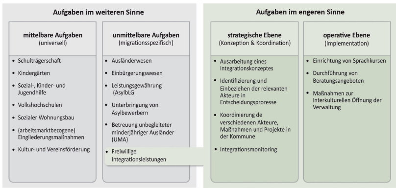
Abbildung 3: Aufgaben kommunaler Integrationsverwaltung

Quelle: Eigene Darstellung in Anlehnung an Bogumil et al. (2018: 74ff.) und Hafner (2019: 106ff.). Die Abbildung erhebt keinen Anspruch auf eine abschließende Aufzählung.