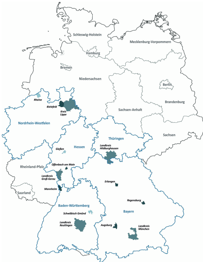
Abbildung 2: Geografische Darstellung der deutschen Fallkommunen