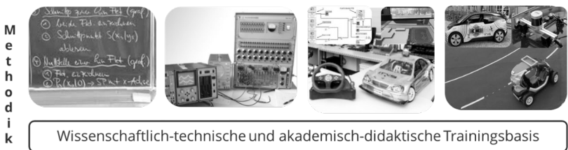
Abbildung 4: Veränderungen der Lern- und Lehrprozesse in der Telematik-ausbildung

Studiengänge gab es noch keine Telematik-Spezialisierung, sondern nur erste grundlegende Studienfächer der Elektrotechnik. Typische Lehrmittel waren Vorlesungen, Seminare und elektrische Simulationen. In den nächsten Jahrzehnten bis Anfang dieses Jahrhunderts wurden Kurse in einfacher grundlegender Telematik entwickelt, welche hier zum Beispiel erstmals durch digitale Simulationen ergänzt wurden. Mit Bezug zum Betrachtungsraum ab Anfang des jetzigen Jahrhunderts bis jetzt haben sich viele streng telematikbezogene Kurse etabliert, insbesondere für das vernetzte Fahren und der Umgebungserfassung sowie Datenfusion. Die moderne automobilen Ingenieurausbildung richtet sich daher derzeit anhand der neuen Forschungs Herausforderungen beim autonomen Fahren aus. Das führt zu angepassten fachübergreifenden Wissensvermittlungsansätze wie Module aus der Mathematik (z.B. Data Mining), Informatik (z.B. Maschinelles Lernen) sowie aus der Fahrzeugtechnik (z.B. reale Feldtests mit Fahrzeugen). Dabei stellen die Praktika mit Livetests und eigener studentischer Datenbasis den substantiellen didaktischen Mehrwert dieser aktuellen Ausbildungsgeneration dar.