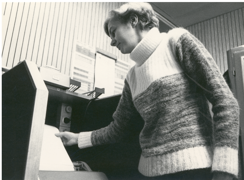
Abbildung 2: DLF-Mitarbeiterin am Fernschreiber

führt. Um 14:17 Uhr schlug das Flugzeug auf die Autobahn und bereits um 15:00 Uhr erfolgte die Verkehrswarnung nach den Nachrichten im Deutschlandfunk. Hier der Originaltext der Meldung: „Auf der Autobahn Nürnberg/München ist zwischen den Anschlussstellen Manching / Langenbruck, ein Flugzeug auf die Fahrbahn gestürzt, der Verkehr in beiden Richtungen wird ab Manching bzw. Langenbruck umgeleitet.“ 16 Bei dem Unglück kamen die 48 Insassen des Flugzeugs ums Leben, lediglich ein Autofahrer wurde verletzt. 17