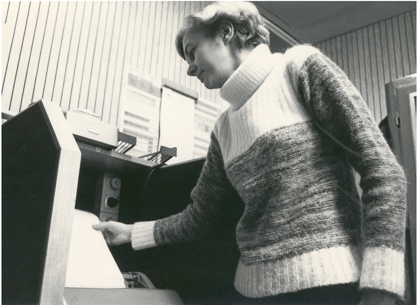
Abbildung 2: DLF-Mitarbeiterin am Fernschreiber

führt. Um 14:17 Uhr schlug das Flugzeug auf die Autobahn und bereits um 15:00 Uhr erfolgte die Verkehrswarnung nach den Nachrichten im Deutschlandfunk. Hier der Originaltext der Meldung: „Auf der Autobahn Nürnberg/München ist zwischen den Anschlussstellen Manching / Langenbruck, ein Flugzeug auf die Fahrbahn gestürzt, der Verkehr in beiden Richtungen wird ab Manching bzw. Langenbruck umgeleitet.“ 16 Bei dem Unglück kamen die 48 Insassen des Flugzeugs ums Leben, lediglich ein Autofahrer wurde verletzt. 17