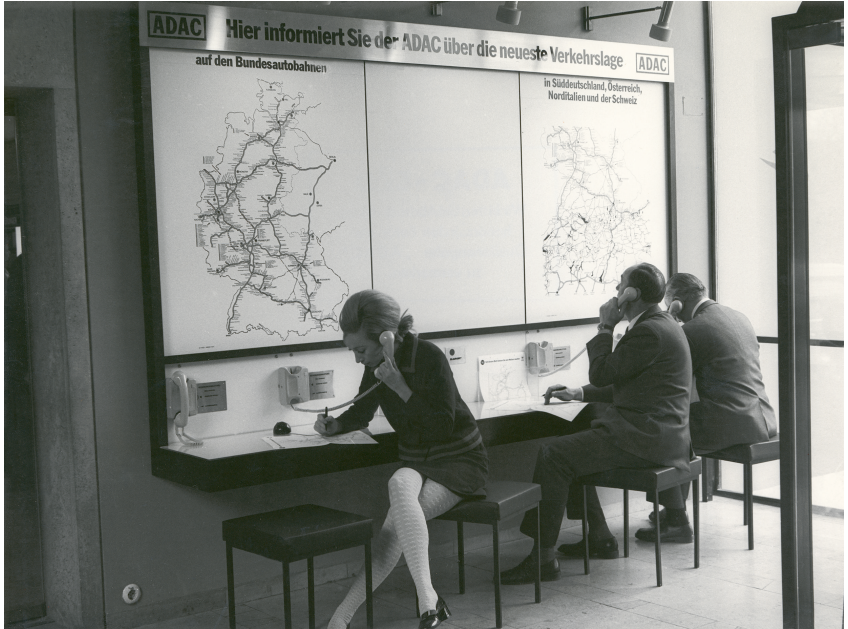
Abbildung 3: Infotheke des ADAC

ist hier als Vorreiter zu erwähnen. Mit diesen Servicewellen wurden die Infotheken zunehmend unattraktiver und in der Folge abgeschafft. Die Zulieferung der Verkehrsnachrichten vom Deutschlandfunk an die ADAC Infotheken endete 1974. Der ADAC schaltete ab diesem Zeitpunkt auf Basis der Durchsagekennung auf die zuständigen Landesrundfunkanstalten um. 21