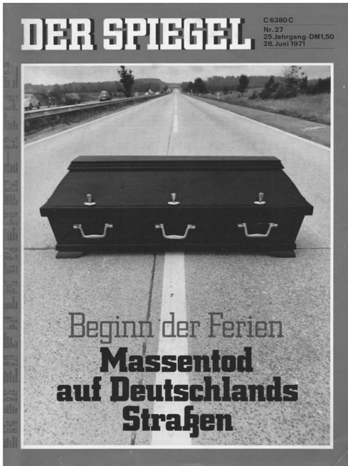
Abbildung 3: Titel Der Spiegel, 27/1971 vom 28.06.1971.

Massenmotorisierung in Form von immer mehr Toten und Verletzten sowie immensen volkswirtschaftlichen Schäden nun immer stärker in das öffentliche Bewusstsein drangen und skandalisiert wurden. „Das Gemetzel, das wir Verkehr nennen“, war 1971 eine Titelgeschichte des „Spiegel“ überschrieben, die weder an drastischen Formulierungen noch an entsprechenden Abbildungen sparte. 47