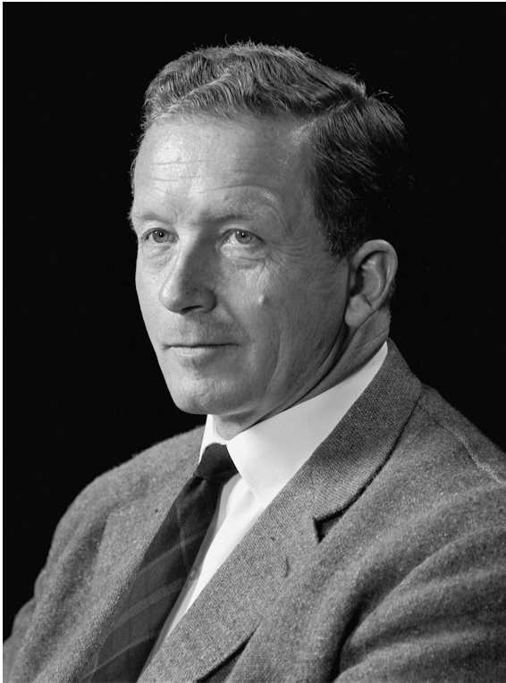
Abbildung 5: WDR-Intendant Klaus von Bismarck.

halboffiziellen Anregungen, die in letzter Zeit an uns herangetragen worden sind“; handeln und „kräftig dazu beitragen [sollte], daß Stauungen vermieden werden.“ 73 Außerdem überlegte er durchaus, wie eine „funkische Form der Verkehrsmeldung“ aussehen könne, um sie zu einem integralen Teil des Programms zu machen. Verkehrsdurchsagen zu jeder vollen Stunde lehnte er jedoch ab, ebenso wie Unterbrechungen von Konzerten oder Wortprogrammen. 74 Intendant v. Bismarck präziserte dies Mitte der 1960er Jahre noch, indem er Weyer wissen ließ, dass „zwischen Beethoven-Sinfonie und Violinkonzert von Max Bruch eine Unterbrechung möglich ist, nicht aber innerhalb der Beethoven-Sinfonie.“ 75