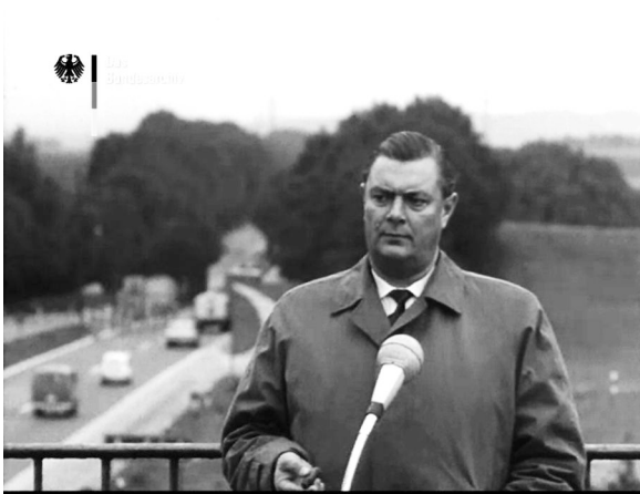
Abbildung 2: Willi Weyer erläutert seine Vorstellungen zur Vermeidung von Staus; UFA Wochenschau Nr. 375/1963 vom 7.10.1963.

die über Baustellen errichtet werden sollten, eine Erhöhung der Autobahn-Mindestgeschwindigkeit von damals 40 km/h und eigene „Lastwagen-Autobahnen“, die er zusätzlich zu den existierenden Trassen nur für den Schwerverkehr bauen lassen wollte. 22 Etwas weniger utopisch mutete sein Vorschlag an, „den Polizeiwarnfunk auch für die Autoradios aus[zu]strahlen“, um „Kraftfahrer schneller auf Stauungen hin[zu]weisen.“ Er sei „auf die Idee gekommen, weil ich selbst einen Telephonapparat im Wagen habe, über den mir die Polizeiwachen durchgeben, wie es auf einer bestimmten Strecke aussieht. Da habe ich mir gesagt, das müsste jeder erfahren können.“ 23 Allerdings wies der Landespolitiker Weyer im selben Atemzug darauf hin, dass es zur Verwirklichung des „Polizeiwarnfunks für die Autoradios“ bundespolitischer Voraussetzungen bedürfe: Der Bund müsse dafür eine Frequenz zuteilen. 24