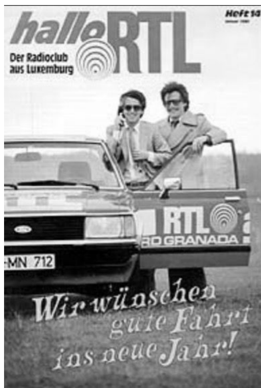
Abbildung 4: RTL-Programmchef Frank Elstner und Moderator Jochen Pützenbacher mit einem Fahrzeug der sogenannten „Granada-Flotte“ (1980)

Konsequenterweise wurde diese Idee ab Juli 1978 noch ausgeweitet: Der Sender schickte nun sogenannte „RTL-Straßenengel“ auf die Autobahnen. Dabei handelte es sich um in den Senderfarben lackierte Wagen mit Fahrern, die „als Pannenhelfer, Abschlepper, Benzinspender und Erste-Hilfe-Experten“ in Not geratenen Verkehrsteilnehmern helfen sollten. 68 Zusätzlich gründete man den Stau-Club , der Hörer anhielt, im Studio anzurufen und Behinderungen zu melden – eine frühe Form von „user generated content“. Damit konnte man die Basis der Meldungen verbreitern und sie beschleunigen, vor allem aber die Hörerbindung stärken, weil das Publikum direkt ins Programm eingebunden wurde. Dem letztgenannten