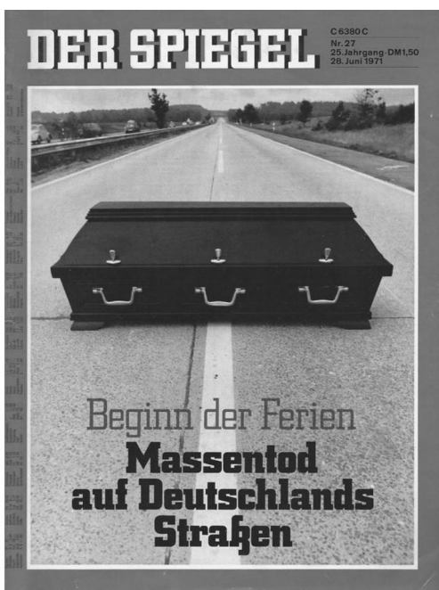
Abbildung 3: Titel Der Spiegel, 27/1971 vom 28.06.1971.

Massenmotorisierung in Form von immer mehr Toten und Verletzten sowie immensen volkswirtschaftlichen Schäden nun immer stärker in das öffentliche Bewusstsein drangen und skandalisiert wurden. „Das Gemetzel, das wir Verkehr nennen“, war 1971 eine Titelgeschichte des „Spiegel“ überschrieben, die weder an drastischen Formulierungen noch an entsprechenden Abbildungen sparte. 47