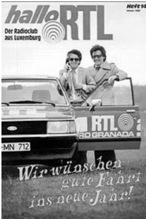
Abbildung 4: RTL-Programmchef Frank Elstner und Moderator Jochen Pützenbacher mit einem Fahrzeug der sogenannten „Granada-Flotte“ (1980)

Konsequenterweise wurde diese Idee ab Juli 1978 noch ausgeweitet: Der Sender schickte nun sogenannte „RTL-Straßenengel“ auf die Autobahnen. Dabei handelte es sich um in den Senderfarben lackierte Wagen mit Fahrern, die „als Pannenhelfer, Abschlepper, Benzinspender und Erste-Hilfe-Experten“ in Not geratenen Verkehrsteilnehmern helfen sollten. 68 Zusätzlich gründete man den Stau-Club , der Hörer anhielt, im Studio anzurufen und Behinderungen zu melden – eine frühe Form von „user generated content“. Damit konnte man die Basis der Meldungen verbreitern und sie beschleunigen, vor allem aber die Hörerbindung stärken, weil das Publikum direkt ins Programm eingebunden wurde. Dem letztgenannten