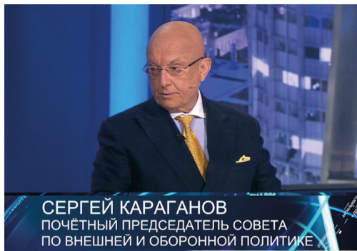
Abbildung 7: Außenpolitiker Karaganov sieht China und Russland als Gewinner des globalen Machtkampfes. Screenshot: TV Zentr. 58

Seite Chinas als zukünftigen Gewinner dieses Kampfes sieht. „Zwischen Russland und China besteht de facto ein strategisches Bündnis. Es ist gut, dass wir zusammen sind, das schwächt ihre Kräfte [...], Amerika wird zweifellos eine große Niederlage in so einem Krieg an zwei Fronten (gemeint sind Russland und China, Anm. d. Autorin) erleiden“, sagte Karaganow in der Talk Show „Prawo snat“ des Senders TV Zentr. 56 Europa sei für Russland nicht mehr interessant, so Karaganow: „Europa hat seine Rolle als Quelle der Modernisierung verloren, die es fast 300 Jahre gespielt hat. [...] Intellektuell und wirtschaftlich sollten wir vom Eurozentrismus loskommen.“ Karaganow sieht die Zukunft Russlands im Osten: „Wir sind Eurasier [...] wir kehren nach Hause zurück.“ 57