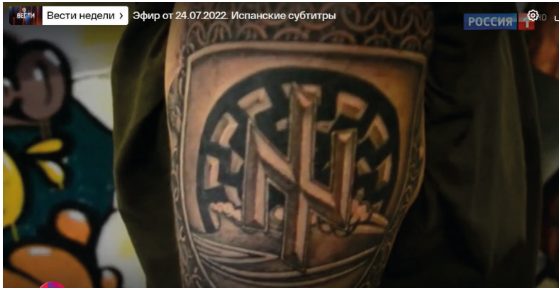
Abbildung 1: Ein Bericht über ukrainische Neonazis in den „Nachrichten der Woche“. 20

Der Kampf mit den ukrainischen Faschisten steht im Fokus der politischen Sendungen, wie hier die „Nachrichten der Woche“. Gezeigt werden glatzköpfige Männer mit nacktem Oberkörper, die sich Nazi-Symbole wie die Wolfsangel in die Haut tätowieren lassen. Anschließend werden ihre mutmaßlichen Foltermethoden detailliert geschildert. 21