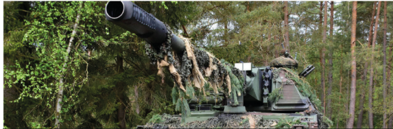
Abbildung 2: Auf deutsche Waffenlieferungen reagiert die russische Führung mit Unverständnis. 31

Es knirscht gewaltig zwischen Deutschen und Russen. Die Russen haben sich daran gewöhnt, russophobe Signale aus Warschau, London oder Washington zu empfangen und dementsprechend zu reagieren. Für Berlin galten in Moskau noch andere Maßstäbe – bis vor kurzem.