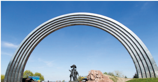
Abbildung 4: In den Berichten von RT DE wird behauptet, dass Russen und Ukrainer ein Volk seien. Screenshot: RT DE. 36

Während von ukrainischer Seite die Abgrenzungsbemühungen vom allem Russischen seit 2014 immer heftiger wurden, versucht Moskau bis heute, die ethnische Ebene aus dem Konflikt herauszuhalten. Eine neue Publikation widmet sich nun dem vermeintlichen Gegensatz zwischen Ukrainern und Russen.