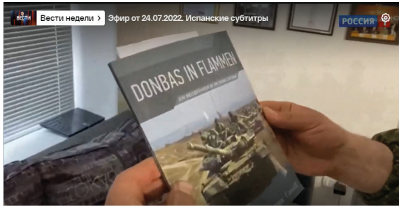
Abbildung 5: Das russische Staatsfernsehen zeigt, wie Soldaten bei der „Entnazifizierung“ Literatur zur Ukraine vernichten. Screenshot: Rossija 1. 42

Dann greift der Soldat ein anderes Buch: „Ukraine – Geschichte eines großen Staates, Geschichte der Zivilisation der Ukraine“, sagt er höhnisch und liest einen Satz auf Ukrainisch vor. Dann sagt er auf Russisch: „Wir sind jetzt mit der Entnazifizierung beschäftigt und werden diese Literatur überall vernichten und nirgendwo auf der ukrainischen Erde werden die Leute mehr so eine Scheiße lesen.“ 43