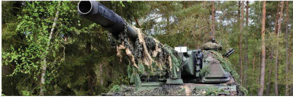
Abbildung 2: Auf deutsche Waffenlieferungen reagiert die russische Führung mit Unverständnis. 31

Es knirscht gewaltig zwischen Deutschen und Russen. Die Russen haben sich daran gewöhnt, russophobe Signale aus Warschau, London oder Washington zu empfangen und dementsprechend zu reagieren. Für Berlin galten in Moskau noch andere Maßstäbe – bis vor kurzem.