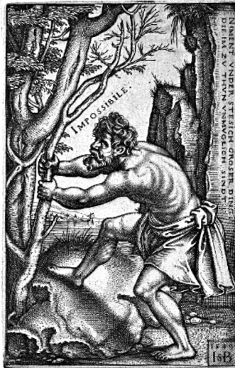
Abb. 1: Hans Sebald Beham: „Impossibile“ [Das Unmögliche]. Der Kupferstich von 1549 enthält die Warnung: „Niment under stesich groser Ding, die im zu thun unmöglich sindt.“ (Bild: gemeinfrei) 7

Um mehr Klarheit in die Überlegungen zu bringen, ist zuerst der wenig eindeutige Begriff des Heils oder der Heilserwartung besser abzugrenzen. Schon auf Hippokrates und Galen zurückgehend gibt es in der Medizin die traditionelle Unterscheidung von medicus curat, natura sanat („Der Arzt behandelt, die Natur heilt“ 8 ), die im Mittelalter noch die Erweiterung um Deus salvat (dt. Gott rettet/erlöst) fand. Es gibt also die kategoriale Trennung von curare, sanare und salvare (dt. behandeln/sorgen, heilen, erlösen), die mit einer klaren Rollenzuteilung an die verantwortlichen Akteure Arzt/Mensch, Natur und Erlöser/Gott einhergeht. Dem Menschen kommt traditionell folglich unmittelbar nur die Aufgabe des Curare zu, ob individuell als ärztliches Behandeln oder kollektiv als Institutionalisierung der Sorge ( Health Care , Medizinsystem, Sozialversicherung usw.). Dem Sanare und Salvare kann jedoch nur Raum gegeben, denn Heilung und Heilserwerb (als Erlösung oder σωτηρία/sotēria , dt. Rettung) geschehen nicht vom Menschen allein aus eigener Kraft.