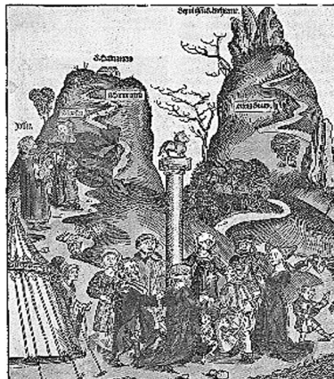
Abb. 3: Biblisches Götzenbild des Goldenen Kalbes in Hartmann Schedels Weltchronik (Nürnberg 1493) 136

Absolutismus und mit einem Höhepunkt in der Französischen Revolution . „Le bonheur est une idée neuve en Europe!“ bekräftigt Saint-Just, der junge Revolutionär und Freund Robespierres, in einer Rede vor dem Konvent 1794: „Europa soll erfahren, dass ihr auf französischem Territorium weder einen Unglücklichen noch einen Unterdrücker mehr sehen wollt, dass dieses Beispiel auf der Erde Früchte trage und die Liebe zur Tugend und das Glück ausbreite! Das Glück ist ein neuer Gedanke in Europa!“ Das allgemeine Glück wird im ersten Entwurf zur französischen Verfassung von 1793 zum ersten Ziel der Gesellschaft: „Le but de la société est le bonheur commun“. Sie trat jedoch nie in Kraft, die blutige Terrorherrschaft des Comité de Salut Public , des Wohlfahrtsausschusses , kam ihr zuvor und übernahm tatkräftig die Sorge für die „öffentliche Wohlfahrt“.