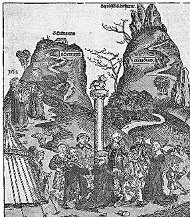
Abb. 3: Biblisches Götzenbild des Goldenen Kalbes in Hartmann Schedels Weltchronik (Nürnberg 1493) (Nachweis: gemeinfrei) 136

Absolutismus und mit einem Höhepunkt in der Französischen Revolution . „Le bonheur est une idée neuve en Europe!“ bekräftigt Saint-Just, der junge Revolutionär und Freund Robespierres, in einer Rede vor dem Konvent 1794: „Europa soll erfahren, dass ihr auf französischem Territorium weder einen Unglücklichen noch einen Unterdrücker mehr sehen wollt, dass dieses Beispiel auf der Erde Früchte trage und die Liebe zur Tugend und das Glück ausbreite! Das Glück ist ein neuer Gedanke in Europa!“ Das allgemeine Glück wird im ersten Entwurf zur französischen Verfassung von 1793 zum ersten Ziel der Gesellschaft: „Le but de la société est le bonheur commun“. Sie trat jedoch nie in Kraft, die blutige Terrorherrschaft des Comité de Salut Public , des Wohlfahrtsausschusses , kam ihr zuvor und übernahm tatkräftig die Sorge für die „öffentliche Wohlfahrt“.