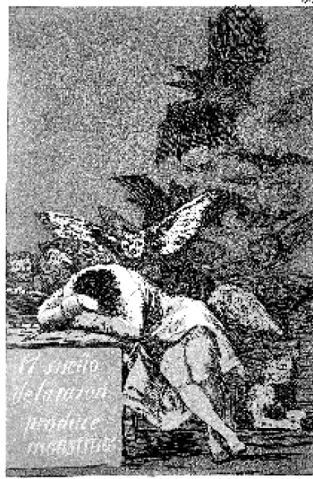
Abb. 2: Francisco de Goya: El sueño de la razón produce monstruos (Der Schlaf [Traum] der Vernunft gebiert Ungeheuer), um 1797–99, Capricho Nr. 43, Radierung, Madrid (Fotografie gemeinfrei) 32

Nach Jürgen Habermas hat gerade die erkenntnistheoretische Orientierung der neuzeitlichen Philosophie zur szientistischen Sichtweise beigetragen, dass „Wissenschaft nicht länger als eine Form möglicher Erkenntnis“ gilt, sondern es zu der Identifikation von „Erkenntnis mit Wissenschaft“ 33 kommt. Nur den als naturwissenschaftlich-objektiv verstandenen primären Qualitäten der Gegenstände im Sinne Galileo Galileis kommt objektive Realität zu, alle Wahrnehmungen und Empfindungen liegen als sekundäre Qualitäten allein im Subjekt. 34 Die Realität verengt sich auf das methodisch Nachweisbare, das streng genommen nur das Messbare ist. Daher das heute alle Forschung bestimmende und genau zutreffende – wiewohl fiktive – Zitat Galileis: „Wer naturwissenschaftliche Fragen ohne Hilfe der Mathematik lösen will, unternimmt Undurchführbares. Man muss messen, was messbar ist, messbar machen, was es nicht ist.“ 35 Wie Max Horkheimer in seiner grundlegenden Abhandlung über die instrumentelle