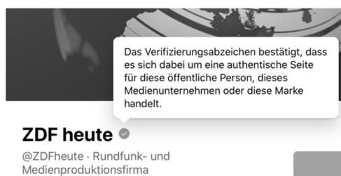
Abb. 2: Hintergrundinformationen zum Verifikationshinweis