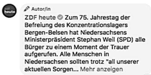
Abb. 1: Verifikation der ZDF heute Seite bei Facebook mittels „blauem Haken“ in der Kommentarspalte

Durch die Kennzeichnung muss der Umstand der Automatisierung erkennbar sein, was nach § 18 Abs. 3 S. 2 einen gut lesbaren Hinweis verlangt, der dem jeweiligen Inhalt bei- oder vorangestellt wird. 1643 Wie dieser Hinweis konkret auszusehen hat, beantwortet die Norm nicht. Wegen der Parallele zu den anderen Kennzeichnungsvorschriften 1644 müsste ein solcher Hinweis so erfolgen, dass ein durchschnittlicher Nutzer die Information ohne Weiteres erkennen kann. Das dürfte etwa durch einen Zusatz hinter dem jeweiligen Profilnamen gewährleistet werden. Insoweit könnte sich eine Parallele zu den vom LG München 1645 angesprochenen blauen Häkchen als Kennzeichnung der Verifikation von Profilen (Abb. 1) anbieten. Konkret könnte statt des Hakens etwa ein entsprechendes Symbol angezeigt werden, dass bei längerem Verweilen des Cursors kurze, prägnante Hinweise auf die Bedeutung gibt und durch einen Link auf ergänzende, ausführlicher Hinweise verweist. Auch dies ist bei dem „blauen Haken“ ähnlich (Abb. 2).