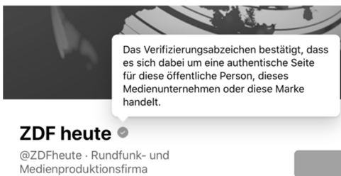
Abb. 2: Hintergrundinformationen zum Verifikationshinweis