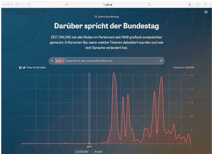
Abb. 4: 70 Jahre Reden im Deutschen Bundestag