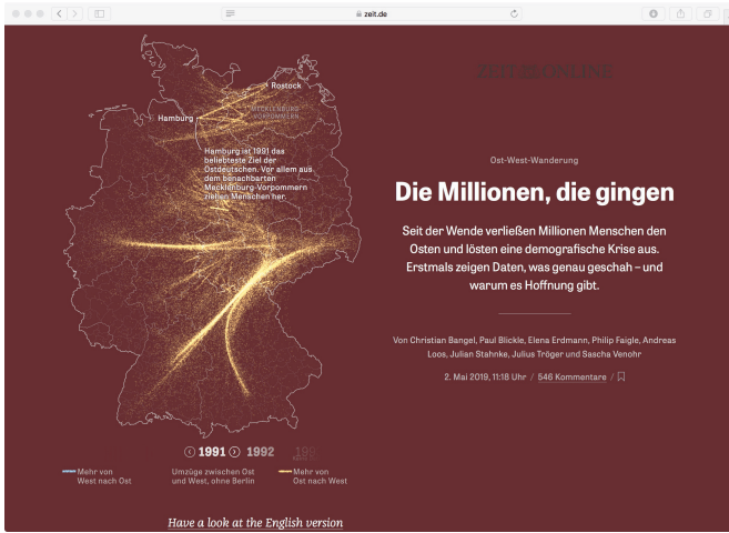
Abb. 1: „Die Millionen, die gingen“