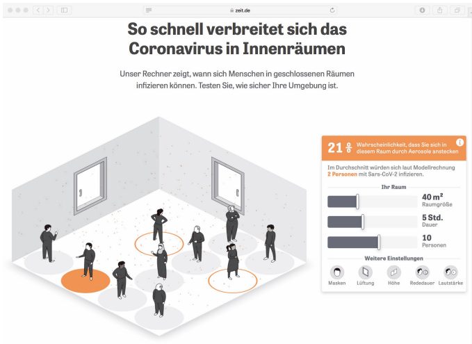
Abb. 3: Animation zur Aerosolverbreitung in Innenräumen