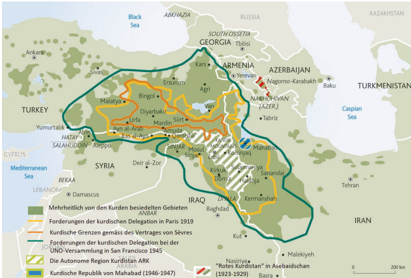
Abbildung 6: Die kurdischen Siedlungsgebiete und Forderungen im 20. Jahrhundert