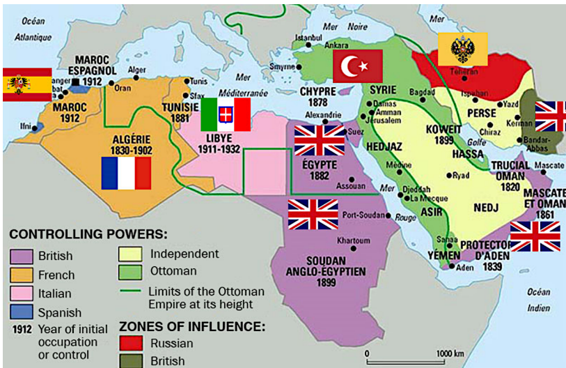
Abbildung 4: Naher Osten und Nordafrika um das Jahr 1914