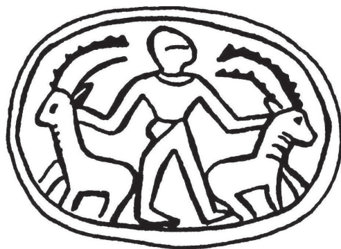
Abbildung: Der Herr der Steinböcke illustriert gut, was mit dem Regieren der Tiere gemeint ist: Skarabäus aus Akko (Tell Fuchar) um 1600 – 1500 v.Chr. (entnommen aus: Henrike Frey-Anthes 2010, Abb. 4; vgl. auch Othmar Keel/ Silvia Schroer 2002, 208, Abb. 161).

Natürlich bleibt auch ein fürsorgliches, gerechtes und uneigennütziges Regieren mit der Anwendung von Gewalt verbunden. Das ist selbst im modernen demokratischen Rechtsstaat nicht anders. Ohne Gewalt lässt sich Ordnung nicht herstellen. Aber die Gewalt soll der Herstellung von Gerechtigkeit dienen. Daran muss sie sich messen lassen: „Die in Gen 1,28 verwendeten Begriffe kibbesch ‚den Fuß setzen auf‘ und radah ‚treten, niedertreten, beherrschen‘ bezeichnen Herrschaft, die ggf. die Anwendung von Gewalt einschließt... Apologetische Exegese, die die Gewaltpunkte völlig auszuklammern sucht... und nur auf die Verantwortung abhebt, trägt zur Verarbeitung der Wirkungsgeschichte dieses Herrschaftsbefehls nicht bei.“ (Othmar Keel/ Silvia Schroer 2002, 181)