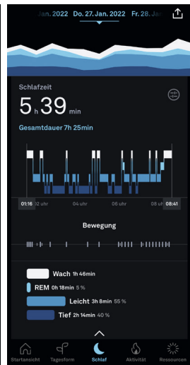
Abb. 3: Übersicht einer Schlafvermessung

Abweichungen von den empfohlenen sieben bis neun Stunden Nachtschlaf spiegeln sich unmittelbar im entsprechenden Schlafwert wider. Einer zunehmenden Verschlechterung des aus Schlafdauer und weiteren Körperwerten bestimmten Scores soll dabei vorrangig darüber begegnet werden, »in den kommenden Tagen länger zu schlafen« (Abb. 1). Der von Oura vermittelten spezifischen Form des Schlafs wird im individuellen Tagesverlauf eine hohe Relevanz und somit ein entsprechender prozentualer Anteil an den als verfügbare Tageszeit bestimmten 24 Stunden zugemessen: »Schlaf sollte Vorrang haben.« (Abb. 2) Als zentrales messbares Gütekriterium des Schlafs gilt also auch die Anrufung einer Regelmäßigkeit und Dauer des Schlafs. Diesen gilt es mithilfe der Technik und einer etablierten Schlafroutine »in die Balance zu bringen« und zu halten. Oura, so die Implikation, gewinnt durch die Vermessung Gewissheit über den Status dieser Balance und ermöglicht Steuerungsmaßnahmen unter Rückbezug auf laborale und alltagsweltlich etablierte Schlafnormen und -wissensbestände.