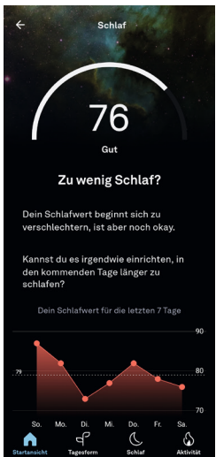
Abb. 1: Wochenübersicht der Veränderung des Schlafwerts

schaftlichen und individuellen Schlaferwartungen und -bedürfnisse und (re-)produziert eine spezifische Form des Schlafs.