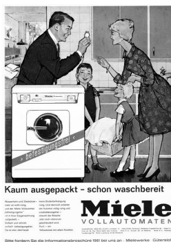
Abb. 1: Miele, Deutschland, 1961

Ziel der Frau an, den Haushalt zu führen und ihrem Ehemann ein wohl-schmeckendes Essen zu servieren. 254 Der Mann wird demgegenüber als selbstbewusster Geschäftsmann, Familienversorger oder abenteuerlustiger Draufgänger porträtiert. 255