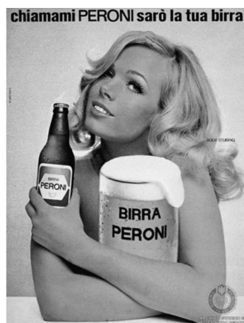
Abb. 5: Birra Peroni , Italien, 1965