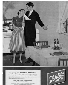
Abb. 3: Schlitz Brewing, Großbritannien, 1950

Werden Mann und Frau in einer Werbung abgebildet, nimmt in der Regel der Mann „die Machtposition der Werbedramaturgie“ ein und die Frau „belehrt oder berichtigt, wenn sie nicht gerade als schmückendes Beiwerk oder als Fachfrau im Haushalt eingesetzt wird“. 256 Steht die Frau im Mittelpunkt der Werbekampagne, geht es zumeist um die Optimierung des Haushalts oder des Familienlebens. 257 In einem Dr. Oetker -Werbefilm von 1954 heißt es beispielsweise: „Eine Frau hat zwei Lebensfragen: Was soll ich anziehen und was soll ich kochen?“ 258 Männer sind demgegenüber in Werbung für Genussmittel wie alkoholische Getränke oder Zigaretten zu sehen. Sie werden als gesellig, karrierebewusst, Experten oder als Ober-