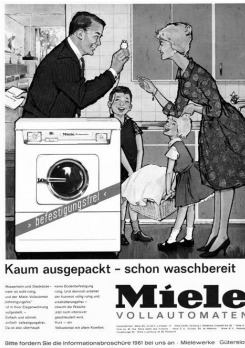
Abb. 1: Miele, Deutschland, 1961

Ziel der Frau an, den Haushalt zu führen und ihrem Ehemann ein wohl-schmeckendes Essen zu servieren. 254 Der Mann wird demgegenüber als selbstbewusster Geschäftsmann, Familienversorger oder abenteuerlustiger Draufgänger porträtiert. 255