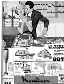
Abb. 2: Moulinex, Frankreich, 1950