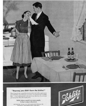
Abb. 3: Schlitz Brewing, Großbritannien, 1950

Werden Mann und Frau in einer Werbung abgebildet, nimmt in der Regel der Mann „die Machtposition der Werbedramaturgie“ ein und die Frau „belehrt oder berichtigt, wenn sie nicht gerade als schmückendes Beiwerk oder als Fachfrau im Haushalt eingesetzt wird“. 256 Steht die Frau im Mittelpunkt der Werbekampagne, geht es zumeist um die Optimierung des Haushalts oder des Familienlebens. 257 In einem Dr. Oetker -Werbefilm von 1954 heißt es beispielsweise: „Eine Frau hat zwei Lebensfragen: Was soll ich anziehen und was soll ich kochen?“ 258 Männer sind demgegenüber in Werbung für Genussmittel wie alkoholische Getränke oder Zigaretten zu sehen. Sie werden als gesellig, karrierebewusst, Experten oder als Ober-