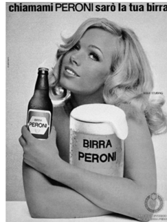
Abb. 5: Birra Peroni , Italien, 1965