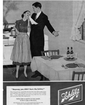
Abb. 3: Schlitz Brewing, Großbritannien, 1950

Werden Mann und Frau in einer Werbung abgebildet, nimmt in der Regel der Mann „die Machtposition der Werbedramaturgie“ ein und die Frau „belehrt oder berichtigt, wenn sie nicht gerade als schmückendes Beiwerk oder als Fachfrau im Haushalt eingesetzt wird“. 256 Steht die Frau im Mittelpunkt der Werbekampagne, geht es zumeist um die Optimierung des Haushalts oder des Familienlebens. 257 In einem Dr. Oetker -Werbefilm von 1954 heißt es beispielsweise: „Eine Frau hat zwei Lebensfragen: Was soll ich anziehen und was soll ich kochen?“ 258 Männer sind demgegenüber in Werbung für Genussmittel wie alkoholische Getränke oder Zigaretten zu sehen. Sie werden als gesellig, karrierebewusst, Experten oder als Ober-