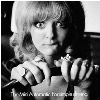
Abb. 4: Mini , Großbritannien, 1968

jedoch weitestgehend dieselben geblieben. 267 Nach wie vor steht die Hausfrau und Mutter im Fokus. Darüber hinaus wird verstärkt auf die junge und attraktive Frau als Werbebild gesetzt. Sie wird vollbusig und spärlich bekleidet oder als naiv und intellektuell beschränkt abgebildet. 268 In einer britischen Werbung der Marke Mini für ein Auto mit Automatikgetriebe ist eine nervöse Frau am Steuer zu sehen. In der Bildunterschrift heißt es: „For simple driving“ (Abb. 4). In Italien illustriert beispielsweise eine Bierwerbung der Marke Birra Peroni , wie Frauen häufig als „sexy Dekorationsobjekte“ eingesetzt werden (Abb. 5).