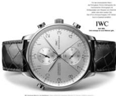
Abb. 15: IWC Schaffhausen, 2002

Scheiben putzen ist Männersache. Bis 42 mm Durchmesser.