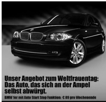
Abb. 16: Sixt, 2011