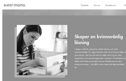
Abb. 34: Supermama, Tegra Nordics, 2019

Demgegenüber kam der RON in einer Werbung für einen Klebstoff zu einem anderen Beurteilungsergebnis. In dieser war in einem ersten Bild eine Frau zu sehen, die ihren Ehemann bittet, Wandhaken im Badezimmer anzubringen. Daneben stand der Text: „Nicht jetzt“ macht uns verrückt. Dauert es eine Woche oder sogar länger, wenn Sie Ihren Partner bitten, einen Haken im Badezimmer zu befestigen?“ In einem zweiten Bild bringt die Frau die Haken dank des beworbenen Klebstoffs selbst an. Hier lautete die Überschrift: „Endlich eine frauenfreundliche Lösung“ (erstes Bild siehe Abb. 34). Der RON führte dazu aus, dass die Werbung den Eindruck erwecke, dass Frauen handwerkliche Aufgaben nicht allein übernehmen könnten und daher einen speziell angepassten Kleber benötigen würden, um Hausarbeiten durchführen zu können. Ebenso lege die Werbung nahe, dass Männer faul wären und Projekte zu Hause häufig verzögern würden. Zusammenfassend würde die Werbung damit nicht nur Frauen, sondern gleichermaßen Männer in stereotyper und abfälliger Weise darstellen. Dementsprechend sei die Werbung sexistisch und verstöße gegen Art. 2 Abs. 1 des ICC-Kodexes. 1253