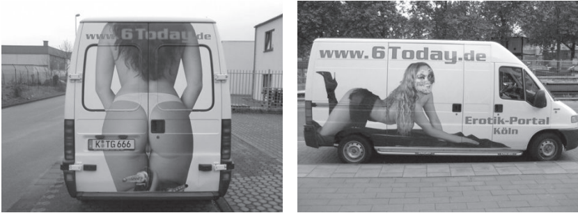
Abb. 11: Kleinlastwagen, Beschluss OVG Nordrhein-Westfalen, 2009

ellen Inhalts umfasst, relevant. 744 Ob eine Werbeanzeige den Tatbestand erfüllt, hängt maßgeblich von zwei Aspekten ab. Zum einen muss es sich um eine Darstellung sexuellen Inhalts handeln. Zum anderen muss die Darstellung in einer derart anstößigen Weise erfolgen, dass von einer unzumutbaren Belästigung der Rezipient:innen ausgegangen werden kann. 745 Eine Darstellung sexuellen Inhalts liegt in der Regel vor, wenn ein menschlicher Körper abgebildet ist und das objektive Erscheinungsbild auf das Geschlechtliche bezogen ist 746 oder sich die Gelegenheit zu sexuellen Handlungen objektiv aus den Umständen ergibt. 747 Darstellungen der Nacktheit sind nur dann sexuellen Inhalts, wenn ein Sexualbezug besonders hervorgehoben wird. 748 Wann eine unzumutbare Belästigung vorliegt, richtet sich nach dem Zusammenhang zwischen der Darstellung und dem Ausstellungsort sowie nach den wertungsgeprägten Grenzen der Zumutbarkeit. 749